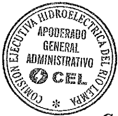
Comisión Ejecutiva Hidroeléctrica del Río Lempa

San Salvador, a los cuatro días del mes de febrero del dos mil dieciséis.