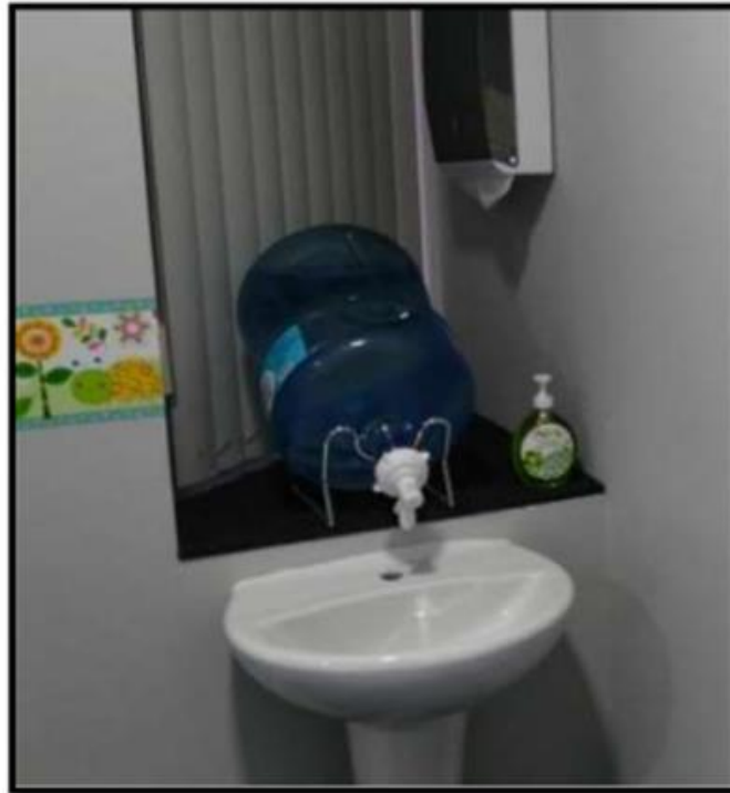
Imagen de apoyo de adaptación de garrafones de agua a lavamanos

Dado que el agua en la institución, no es de muy buena calidad, se adecuará el suministro de agua de garrafón para el lavamanos.