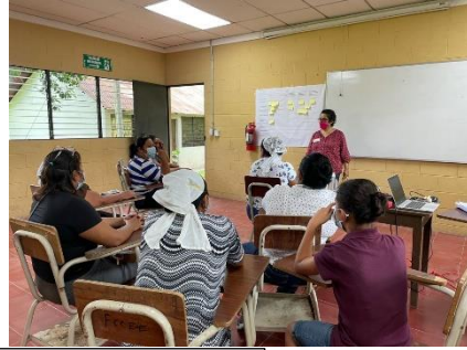
Taller en el municipio de San Pedro