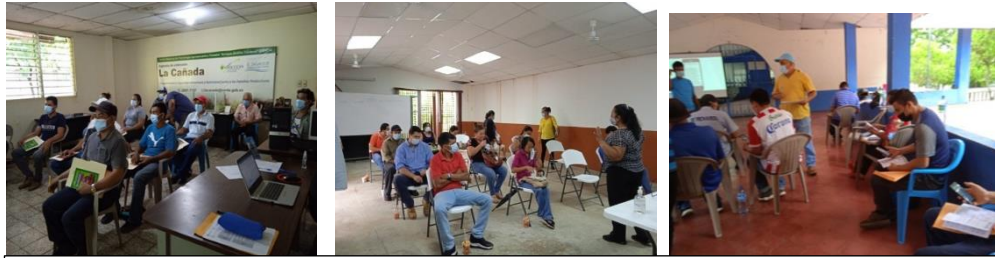
Capacitación a extensionistas comunitarios de Jocoro, La Cañada y San Alejo