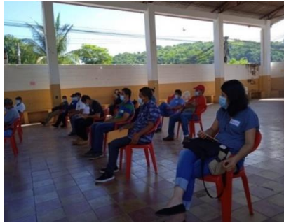
Municipio de Yamabal