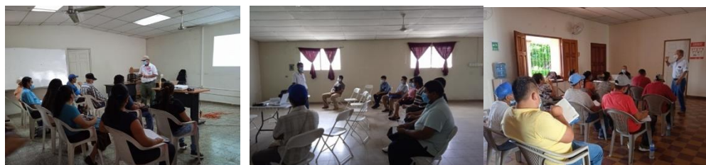
Capacitación a extensionistas comunitarios de Santa Elena, Comacaran y San Miguel