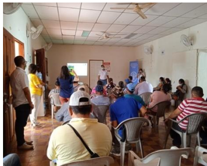
Municipio de Chirilagua