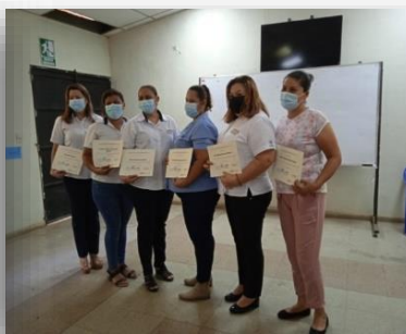
Curso ABC de la Igualdad Sustantiva con personal técnico y administrativo, de las agencias de extensión de Sesorí, Nueva Guadalupe, Usulután, Nueva Esparta