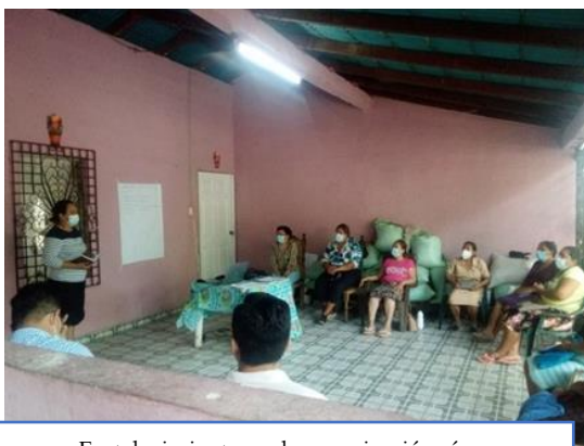
Fortalecimiento en la organización, área administrativa de la Asociación Cooperativa, realizada en Caserío Santa Lucía, municipio San Miguel