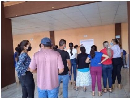
Municipio de La Unión