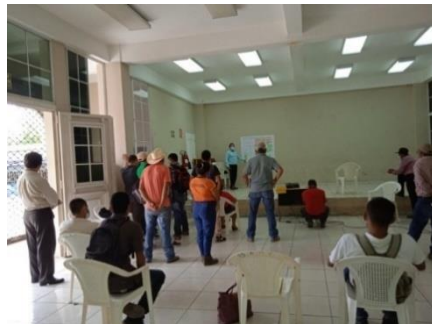
Municipio de Chirilagua