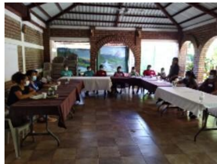
Taller en el municipio de Tacuba