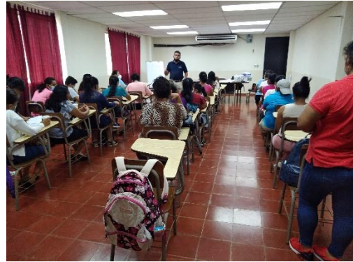
Taller en el municipio del Peñon

Apoyo en la ejecución Diagnóstico Rápido Participativo con Enfoque de Género con productoras, productores y actores municipales.