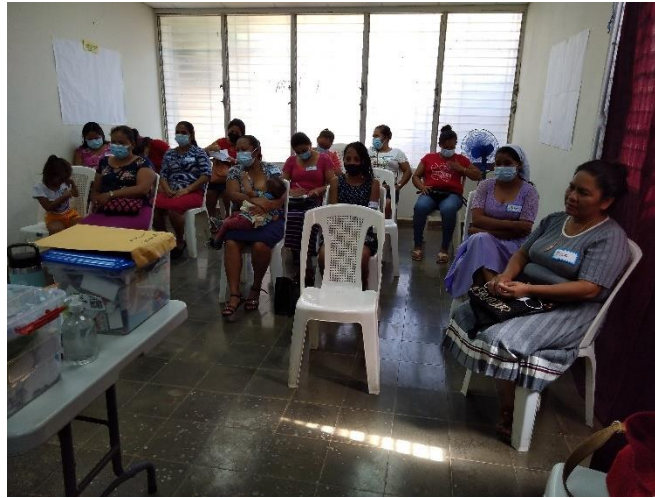
Taller en el municipio de San Francisco Menéndez