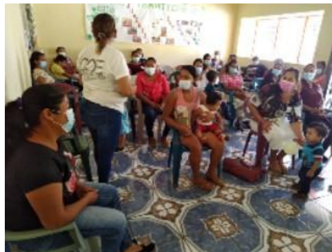
Taller en el municipio de Atiquizaya