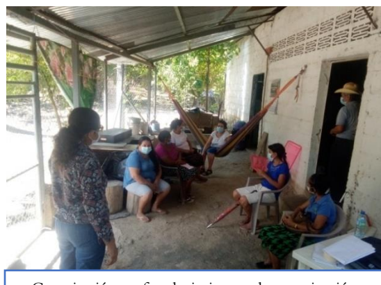
Capacitación en fortalecimiento a la organización con asociadas y asociado de ACOPAM; realizado en Cantón El Hormiguero, municipio de Comacaran