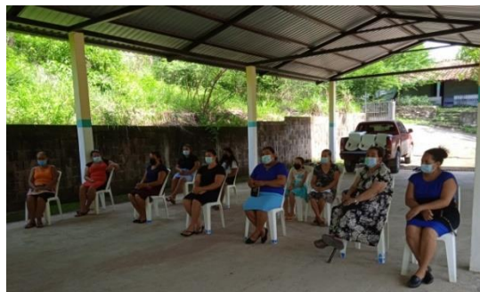
Capacitación en administración a ACOPAPERBET, realizada en Caserío El Tempisque, municipio Estanzuelas