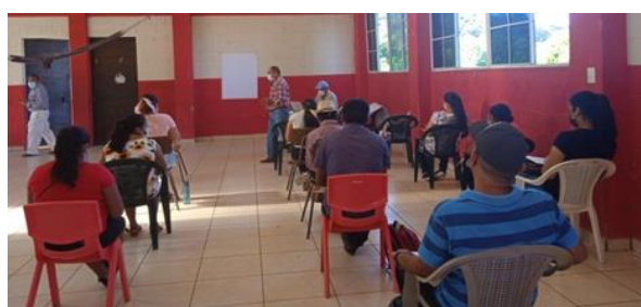
Extensionistas Comunitarios de San Francisco Gotera