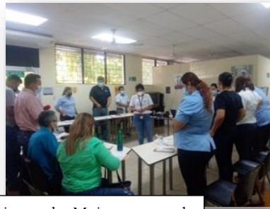
Curso de ABC Vida Libre de Violencia para las Mujeres personal de las agencias de extensión de Usulután, Santa Elena, Jiquilisco