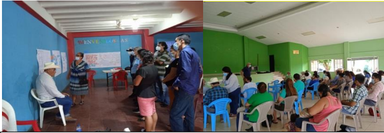
DRP con Enfoque de Género en Mercedes Umaña y Puerto El Triunfo