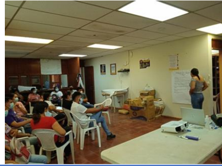
Capacitación Trabajo en Equipo, ECA de jóvenes de las comunidades del municipio de Sesori.