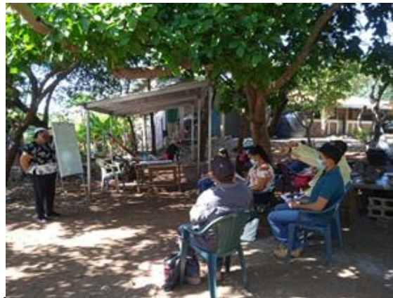
Extensionista comunitaria de Cantón El Ciprés, municipio de Conchagua, socializando el Proyecto RECLIMA