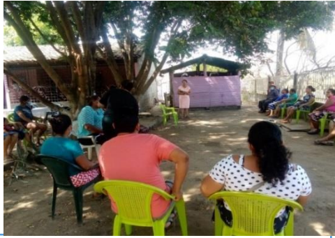
Capacitación en habilidades para la vida; productoras de Asociación Cooperativa Mujeres con Proyección, Caserío Santa Lucía municipio San Miguel