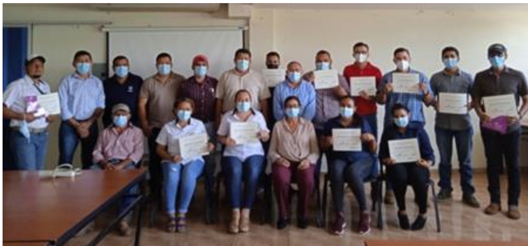
Curso ABC a la Igualdad Sustantiva con personal técnico y administrativo de las agencias de extensión de Sesorí, Nueva Guadalupe, Usulután, Nueva Esparta