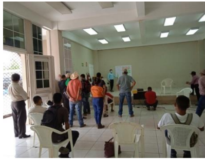
Municipio de Jiquilisco