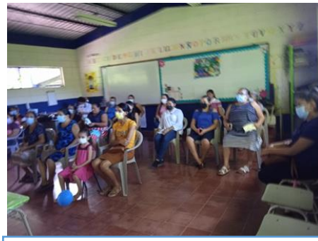
Capacitación en habilidades para la vida; productoras de Cantón Huertas Viejas, municipio Anamoros.