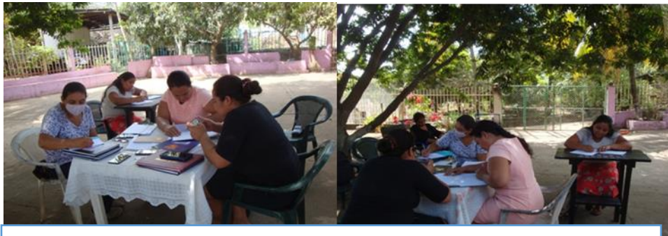
Jornada de capacitación en habilidades para la vida; productoras de Asociación Cooperativa Mujeres con Proyección, Caserío Santa Lucía municipio San Miguel