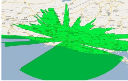
Cobertura a los 6,000 pies de Altura