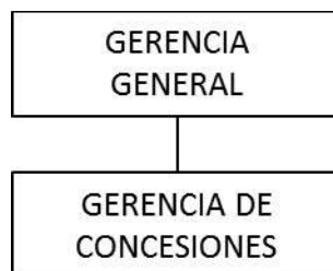
ORGANIGRAMA DE LA GERENCIA DE CONCESIONES (1 de Nov 2012)