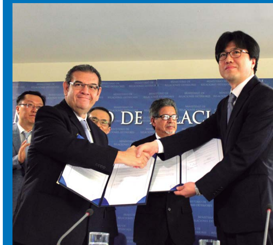
CEPA y el Aeropuerto Internacional de Incheon, presentan memorándum de entendimiento para cooperación en materia aeroportuaria.