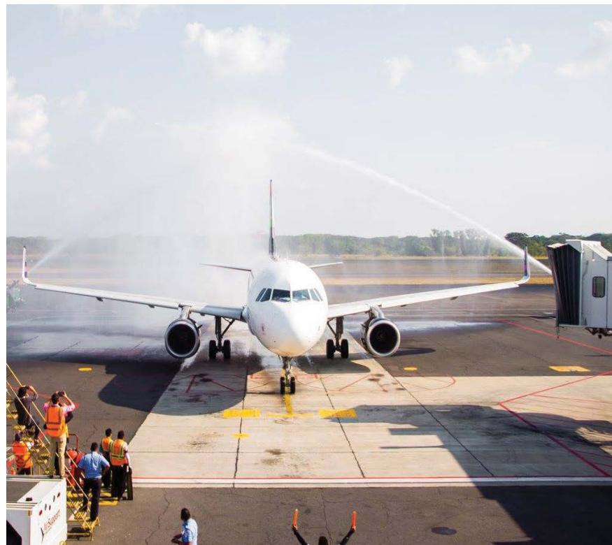
Autoridades de CEPA recibieron el primer vuelo de nuevas aerolíneas operando en el aeropuerto. Volaris realiza vuelos a San José, Costa Rica y hacia Guatemala. Air Transat a Toronto, Canada.