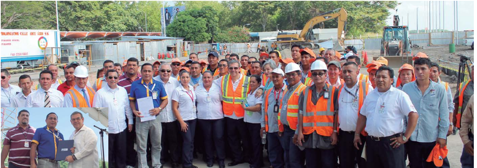
El Presidente de CEPA firmó el nuevo Contrato Colectivo de Trabajo con SITEAIES del Aeropuerto Internacional de El Salvador Monseñor Oscar Arnulfo Romero y Galdámez.