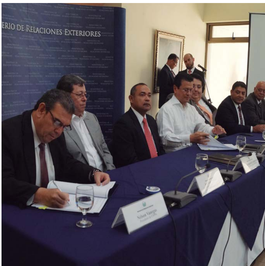
CEPA firma convenio interinstitucional por ventanilla del Proyecto para la Agilización y simplificación de los trámites migratorios.