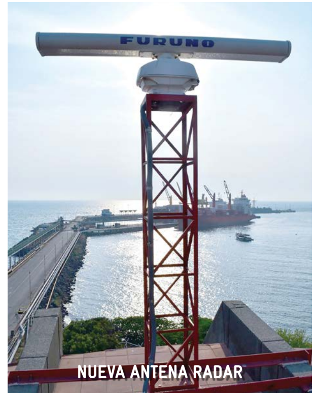
NUEVA ANTENA RADAR