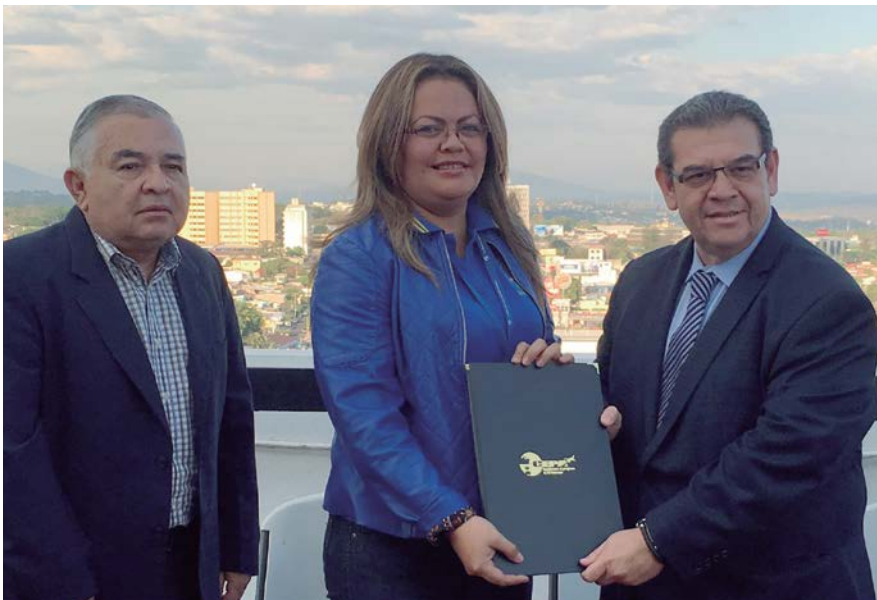
Autoridades de CEPA entregó a SITEAIES de Oficina Central el primer Contrato Colectivo de los empleados de Oficina Centrale.