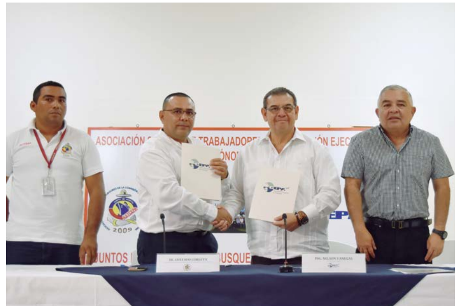
Autoridades de CEPA entregan a ASTCEPA el Contrato Colectivo de Trabajadores del Puerto de Acajutla.

CEPA GANA PREMIO 3M A LA SALUD OCUPACIONAL Y SEGURIDAD AMBIENTAL