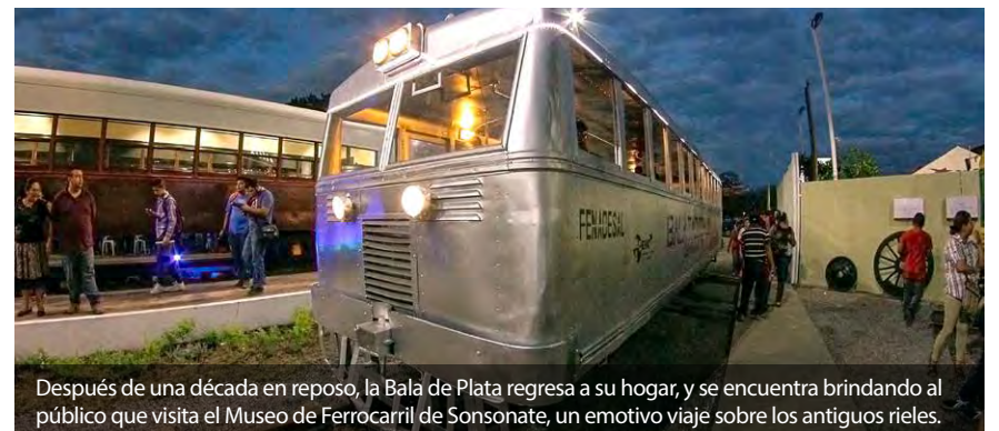
Después de una década en reposo, la Bala de Plata regresa a su hogar, y se encuentra brindando al público que visita el Museo de Ferrocarril de Sonsonate, un emotivo viaje sobre los antiguos rieles.

Ubicado dentro del Museo del Ferrocarril y Parque Temático de El Salvador en FENADESAL, nace para brindarle al visitante un lugar donde disfrutar del sano esparcimiento, al finalizar el recorrido por el museo, para degustar un delicioso café de altura, elaborado y servido por manos salvadoreñas.