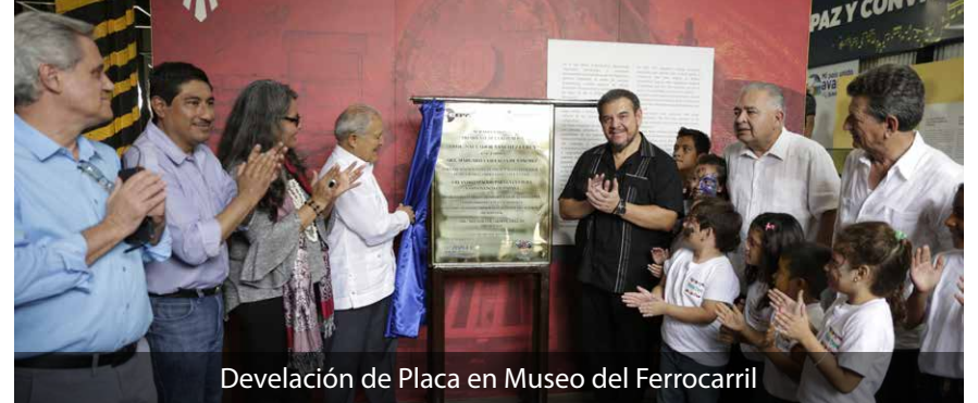
Develación de Placa en Museo del Ferrocarril