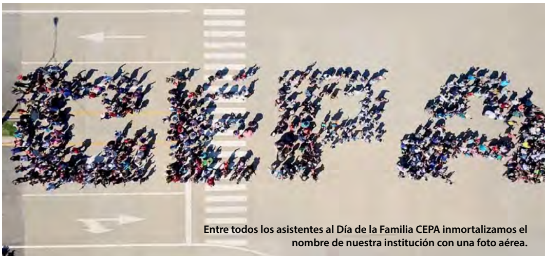
Entre todos los asistentes al Día de la Familia CEPA immortalizamos el nombre de nuestra institución con una foto aérea.