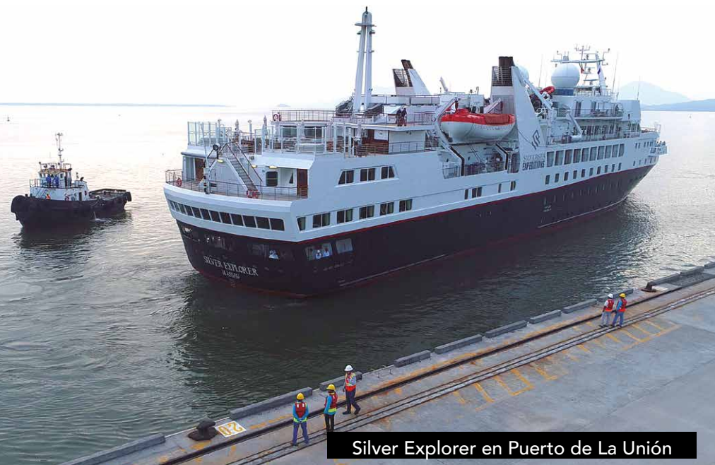
Silver Explorer en Puerto de La Unión

En el Puerto de La Unión y Puerto de Acajutla brindamos instalaciones adecuadas para el transporte de turistas y la atención de grandes embarcaciones y cruceros internacionales que han atracado en nuestro puerto, quedando demostrado nuevamente nuestra amplia capacidad no solo en el manejo logístico sino en la atención a este tipo de buques cruceros con turistas deseosos de conocer más de nuestro País.