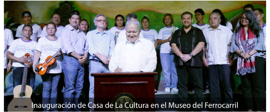
Inauguración de Casa de La Cultura en el Museo del Ferrocarril