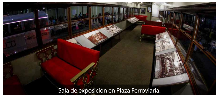
Sala de exposición en Plaza Ferroviaria.