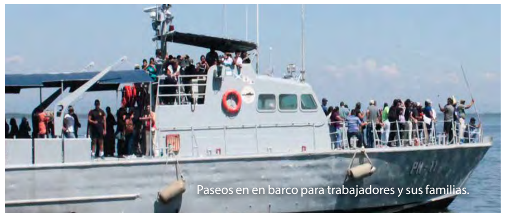
Paseos en en barco para trabajadores y sus familias.

CEPA reconoce el valor de cada uno de nuestros empleados en sus diferentes empresas, por ello se designa y premia con un día de sana convivencia familiar, bajo un ambiente de armonía entre todos sus asistentes, creando así un sentido de pertenencia de esta institución, que demanda de nuestros empleados todo su compromiso y dedicación día con día.