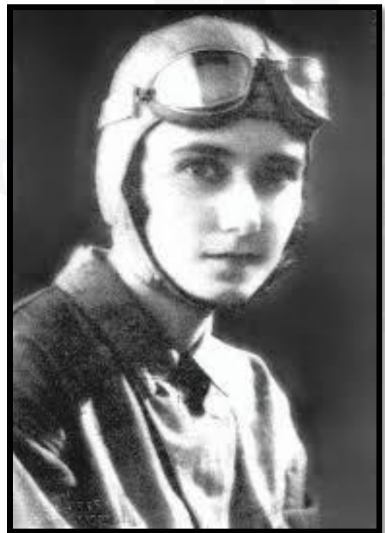
Imagen 6. Violeta Guirola de Avila, primera aviadora centroamericana.

Otra personalidad salvadoreña destacada en los inicios de la aviación y que vale la pena mencionar a pesar de no haber volado en El Salvador es Violetta Guirola de Ávila, primera mujer piloto en Centroamérica. Esta mujer voló por 20 minutos sobre Guatemala el domingo 9 de octubre de 1921. 6