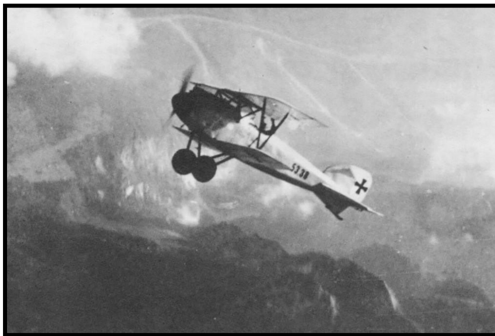
Imagen 7. Albatros D. III alemán, utilizado en 1917.

Durante el conflicto de la Primera Guerra Mundial o la Gran Guerra (1914-1918), los avances tecnológicos de principios del siglo fueron aplicados al armamento para el conflicto bélico; ametralladoras, blindados, tanques, gases y aviones fueron parte de los nuevos equipos utilizados. Anteriormente, España y otros países habían experimentado el uso del globo durante la Guerra Hispanoamericana. En el caso de la Gran Guerra, los aviones y cazaderos fueron utilizados para que los pilotos y sus acompañantes vieran las trincheras enemigas y las fotografieran 7 .