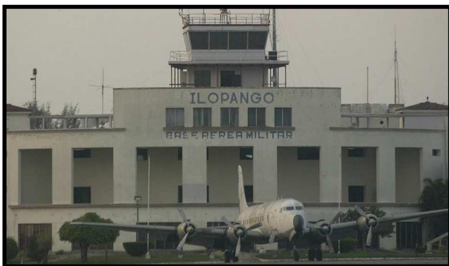
Imagen 14: Fotografía del Diario de Hoy, Aeropuerto Internacional de Ilopango, quedo habilitado únicamente para uso militar y aviación civil (taxis aéreos particulares), administrándolo la Fuerza Aérea Salvadoreña, en octubre de 1987.

Desde que iniciaron las operaciones en el nuevo aeropuerto, las instalaciones del aeropuerto de Ilopango fueron ocupadas por la fuerza aérea salvadoreña y una pequeña zona fue destinada a la dirección de aeronáutica civil donde están ubicadas las oficinas de zarpe, migración, migración, aduanas y cuarentena, para atender la llegada de aviones civiles privados, nacionales y extranjeros.