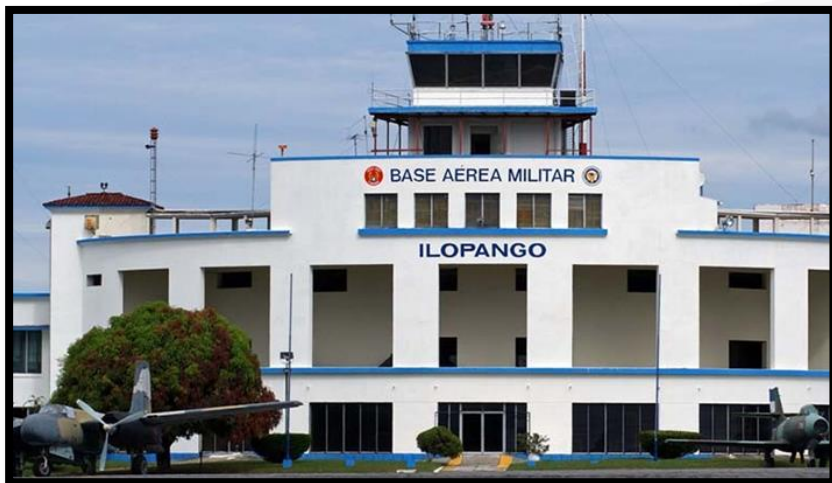
Imagen No. 15 Diario de Hoy, Ilopango reactivara vuelos centroamericanos, marzo de 2014.