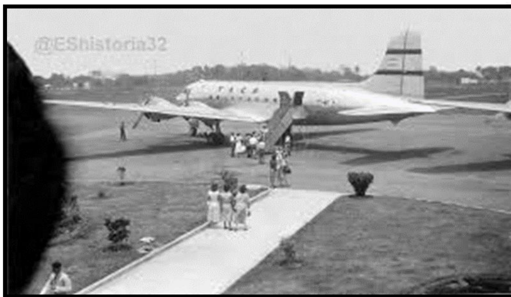
Imagen 10: vuelos comerciales en los años 50's en el Aeropuerto de Ilopango.

Entre las primeras líneas aéreas que ocuparon en El Salvador mencionaremos a Transportes Aéreos Centroamericanos “TACA” que fue fundada por el Piloto Aviador Neozelandés de la Primera Guerra Mundial Lowell Yerex, quien llegó a Centro América con su monoplano Monomotor Stinson, como un aventurero que exploraba sobre posibilidades de la aviación comercial en el área Centroamericano. Inició