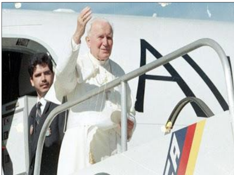
Imagen 13. Arribo del papa Juan Pablo II al aeropuerto de Ilopango.