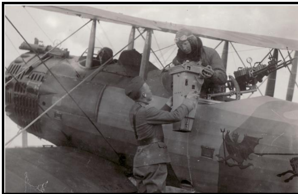
Imagen 8. Mientras el piloto maniobraba, el acompañante se encargaba de fotografiar con cámaras rudimentarias las trincheras enemigas. En la imagen se observan dos pilotos norteamericanos cargando la cámara al biplano.

Como se ha mencionado anteriormente, durante los inicios de la aviación en El Salvador no existía ningún tipo de aeródromo, el campo de Marte utilizado en muchas ocasiones para demostraciones no reunía las condiciones para el aterrizaje de naves aéreas, así que el presidente Carlos Meléndez dono una parte de la finca Venecia, preparando el terreno y construyendo un hangar para tal fin 9 .