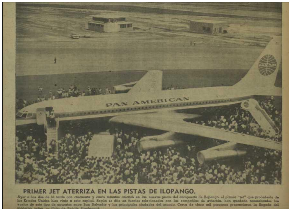
Imagen 11. Recorte de periódico con fotografía del primer Jet que aterrizó en el aeropuerto de Ilopango, procedente de Estados Unidos.

En casi todos los países centroamericanos surgieron empresas de aviación nacionales, en los casos de Costa Rica (LACSA), Honduras (SAHSA), y Panamá (COPA), apadrinadas por Pan American Airways, en Guatemala (AVIATECA) y en Nicaragua (LANICA) como iniciativas de empresarios locales.