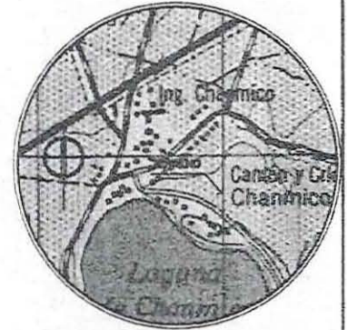
ESQUEMA DE UBICACION