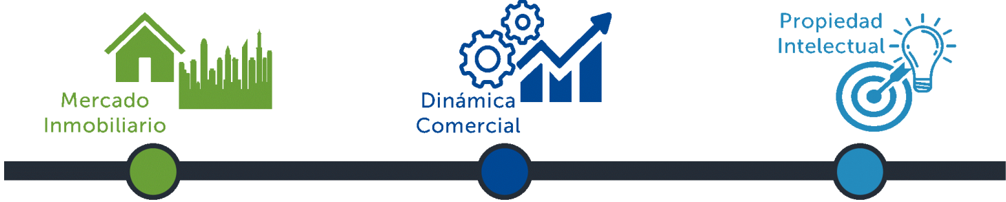
Ilustración 1: Segmentos clave de la actividad del CNR, comportamiento y tendencia de la demanda de servicios en cada segmento