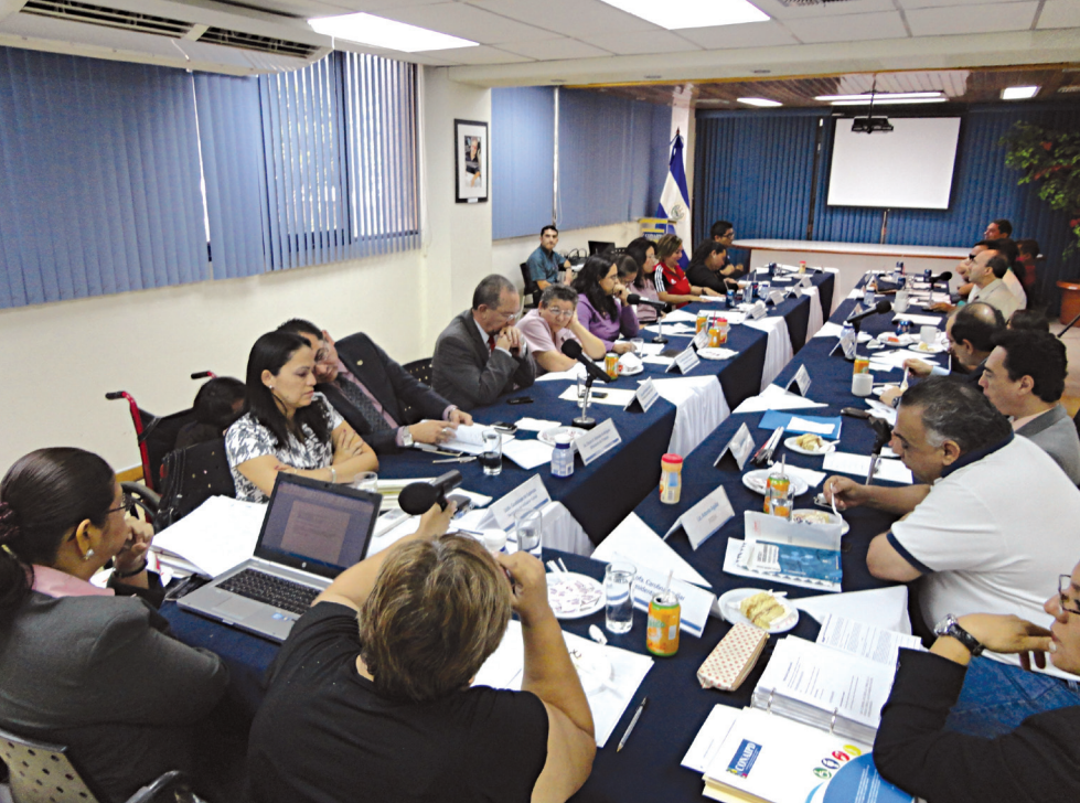
Concejo en pleno