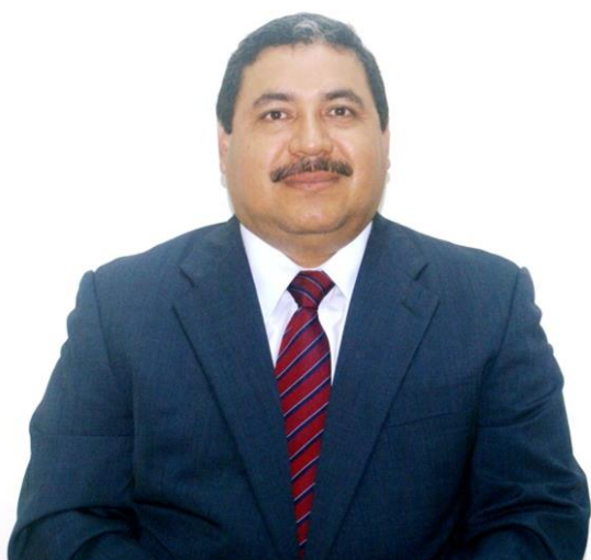
Presidente JESÚS MARTÍNEZ Febrero 2015 – enero 2017

Externo un fraterno saludo a las personas con discapacidad, a las organizaciones que les representan, a las diferentes instituciones del Gobierno conformadas en el Pleno y Comité Técnico; así como a todas y todos quienes de una u otra forma han coadyuvado al avance de acciones en el cumplimiento de los derechos de las Personas con Discapacidad en el país.