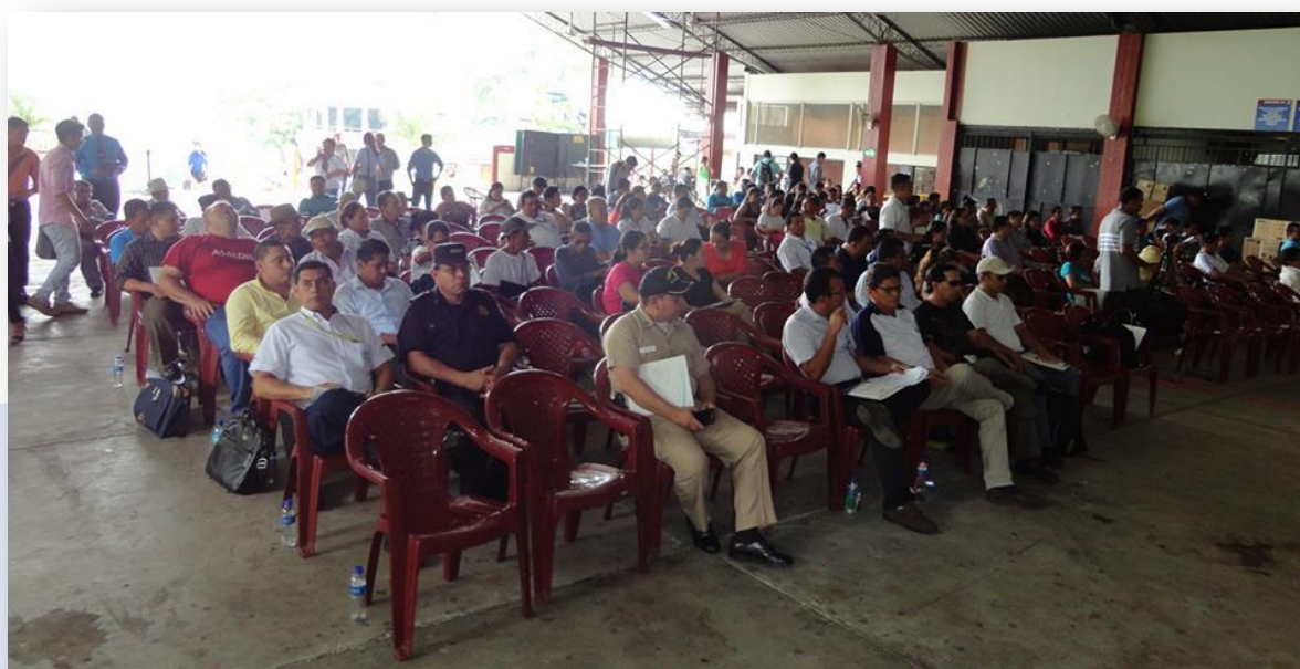
El lanzamiento de la Primera Lectura se realizó en el departamento de San Miguel.

Otro hallazgo importante ha sido el identificar que según los resultados, la niñez y adolescencia reflejan una mayor participación en los diferentes ámbitos principalmente en la educación lo cual estaría siendo abonado por las políticas públicas actuales que brindan más oportunidades para la asistencia escolar a esa población. De allí la importancia de identificar oportunamente, a las personas con discapacidad para visibilizarlas en las políticas públicas y garantizar cada uno de sus derechos, por ejemplo, el acceso a la educación, a la salud y al empleo prioritariamente.