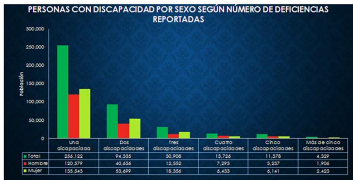
Gráfico No. 1 – Personas con discapacidad por sexo, según número de deficiencias reportadas

El 62% de la población en estudio, posee un tipo de deficiencia, el 23% posee de dos tipos, el 7.5% posee tres deficiencias, el 3.3% cuatro deficiencias, el 2.8% cinco y el 1.1% tiene más de cinco deficiencias.