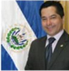
Licenciado José Armando Flores Alemán Ministro de Economía