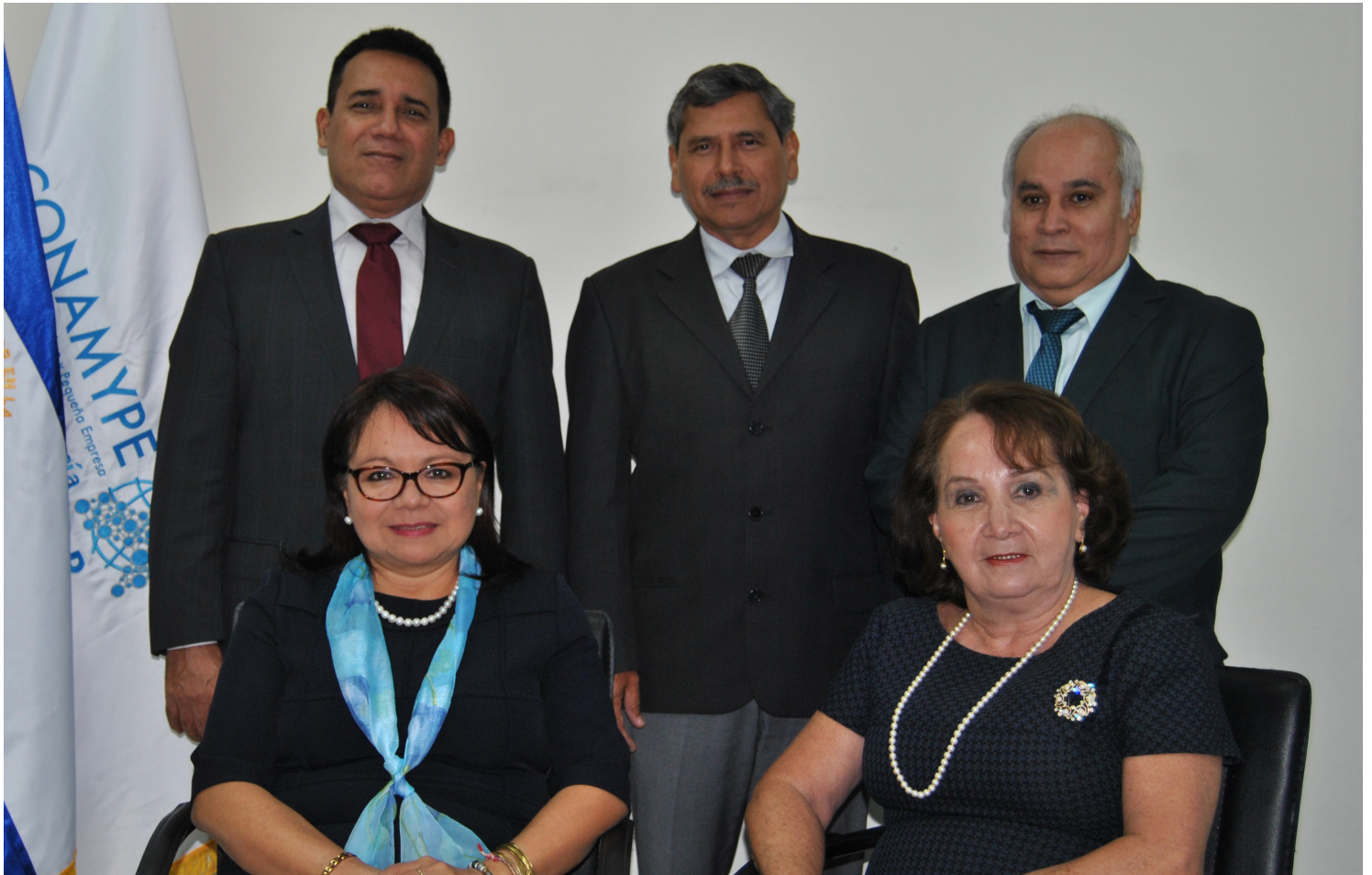
Integrantes de Junta Directiva a partir del 7 de diciembre 2017

A continuación se resumen las actividades que se llevaron a cabo bajo la nueva figura autónoma de la Comisión Nacional de la Micro y Pequeña Empresa (CONAMYPE), desde el 7 al 23 de diciembre del año 2017.