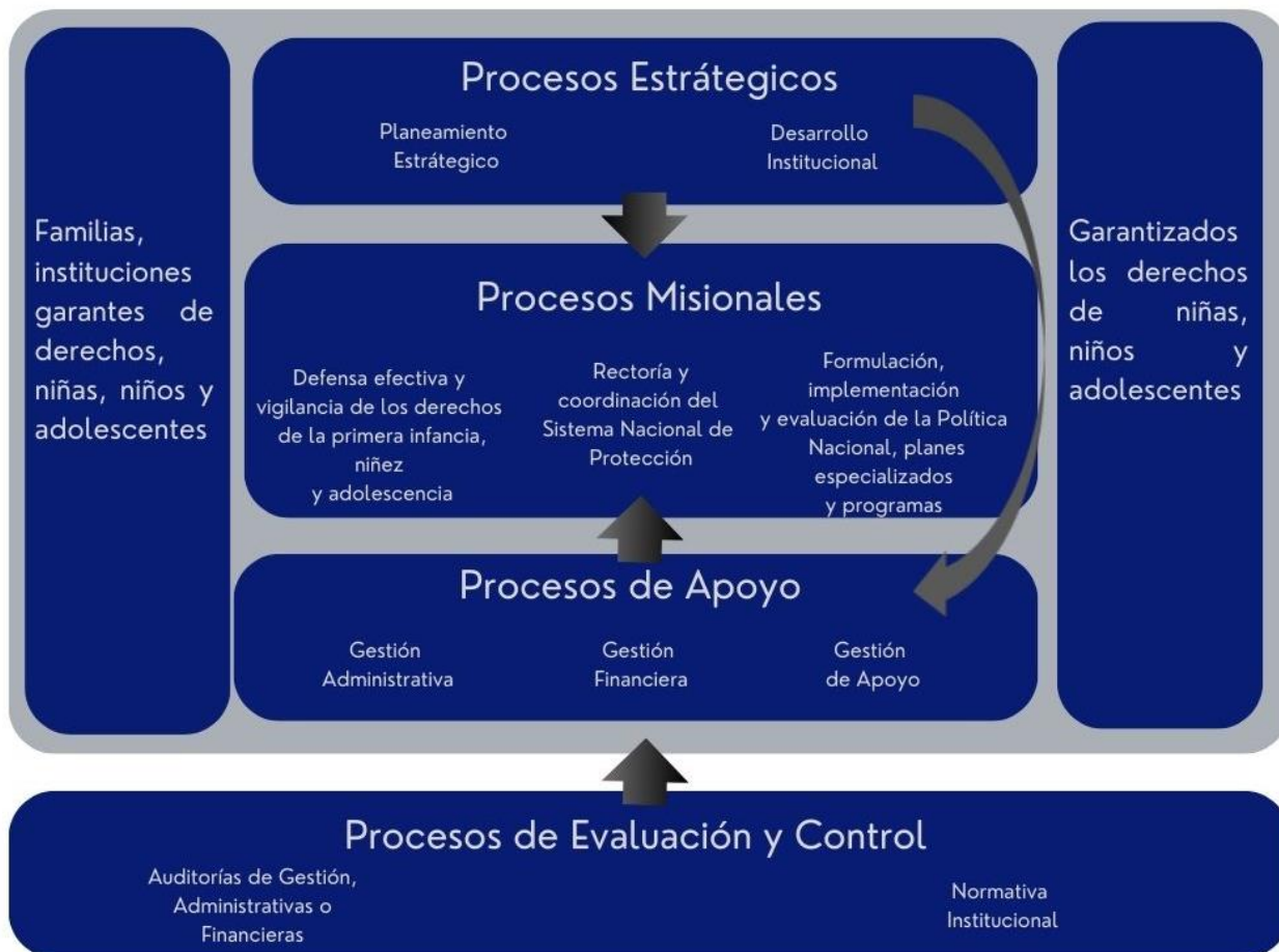
Figura 1. Mapa de procesos CONAPINA

Nota: Elaborado a partir del proceso consultivo para la construcción del PEI y los fundamentos normativos de la Ley Crecer Juntos.