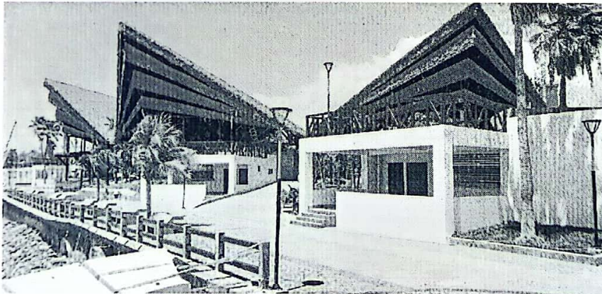
Fotografía 5. Vista General del Proyecto