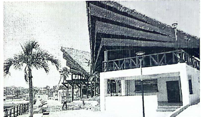
Fotografía 4. Malecón y kiosco B