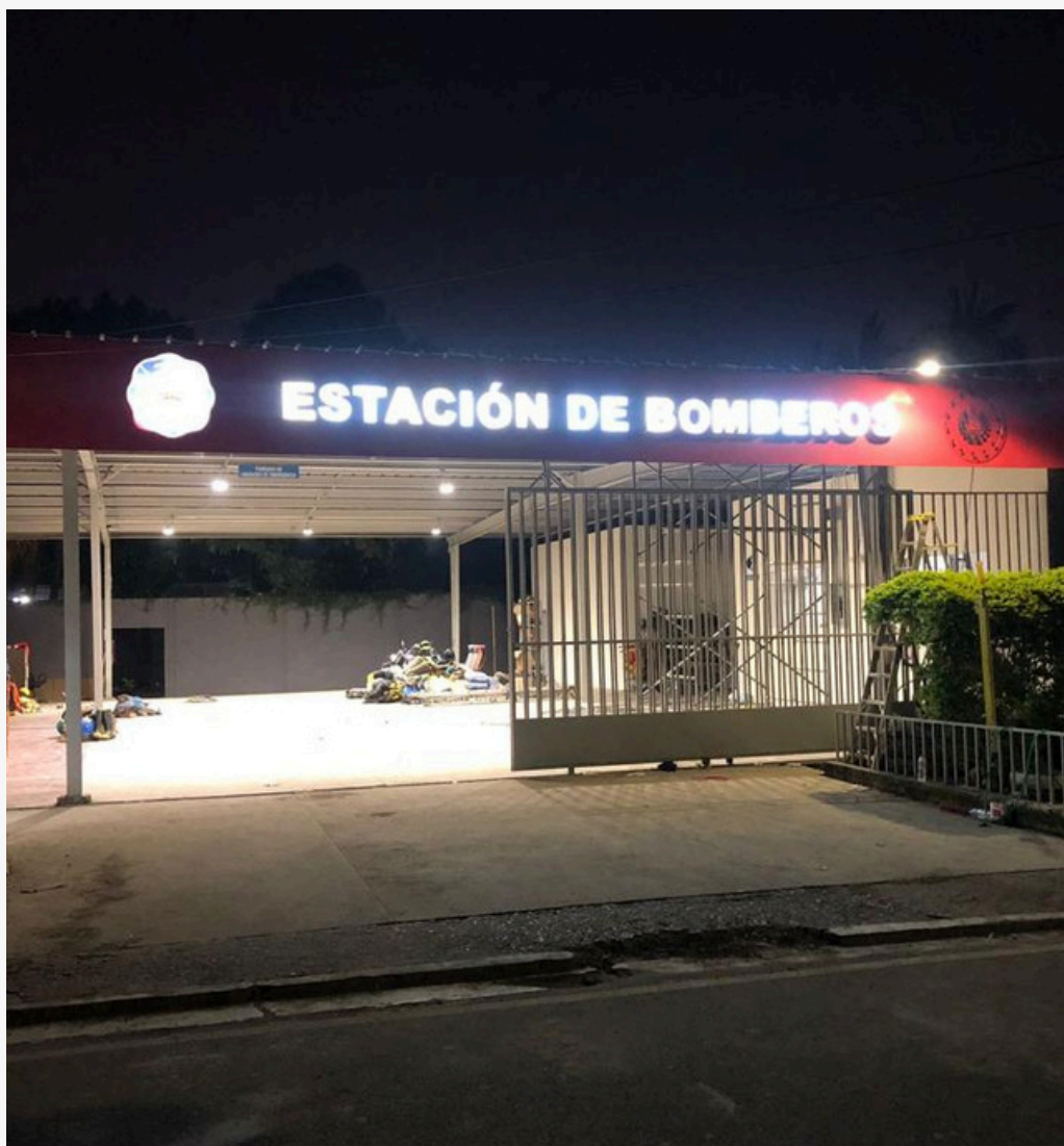
Estación de Bomberos Usulután