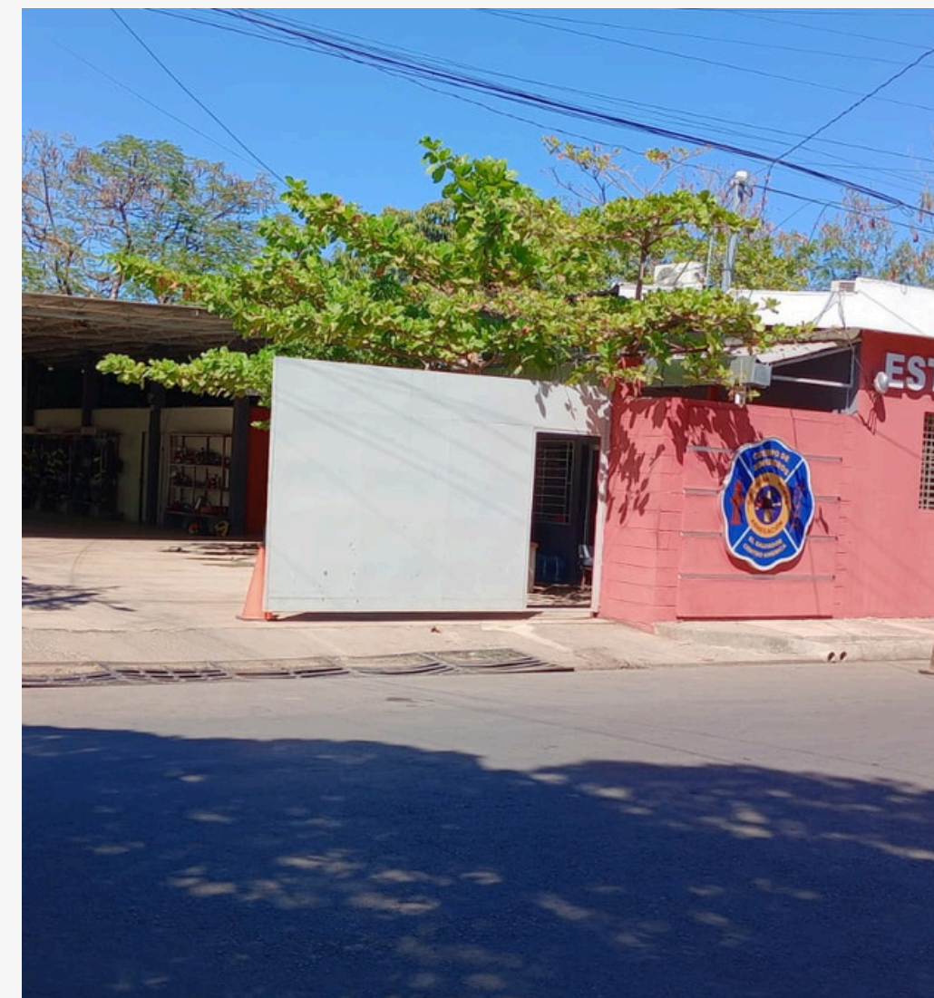
Estación de Bomberos La Unión

Las estaciones de Usulután y La Unión ya han sido remodeladas con éxito, con una inversión de $283,659.36 financiados por el Gobierno.