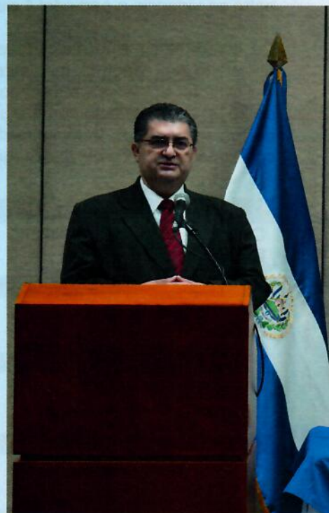
PRESIDENTE DEL CVPCPA

Este Consejo, ha cumplido su tarea y continuará desempeñándose con el compromiso técnico y ético que lo ha caracterizado, por la dignificación profesional, su fortalecimiento y beneficio de la sociedad salvadoreña.