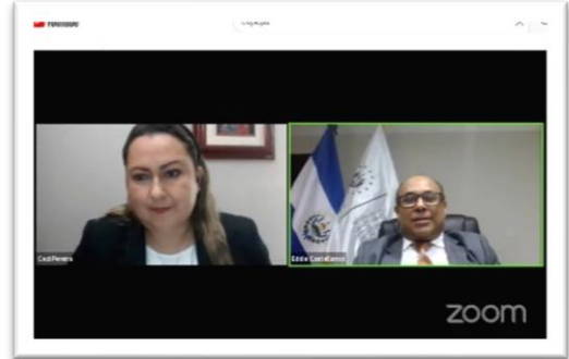
Weinar gratuito: Informe de Cumplimiento sobre la prevención de Lavado de Dinero y Activos Financiamiento al Terrorismo y Proliferación de Armas de Destrucción Masiva.