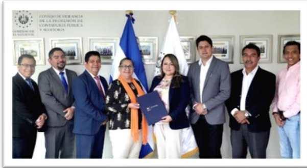
La Presidente del Consejo firmó, recientemente, convenio con las Asociaciones a fin de promover la Educación Continua.