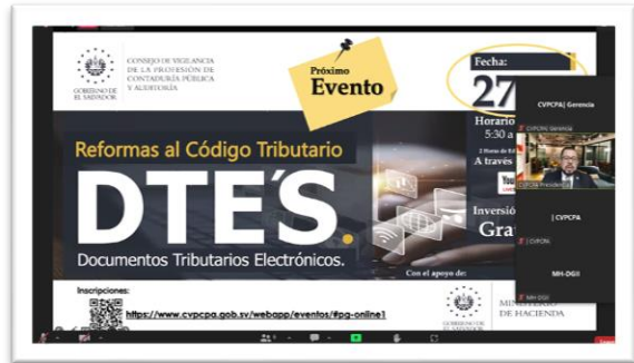
Webinar Reformas al Código Tributario, impartido gratuitamente.