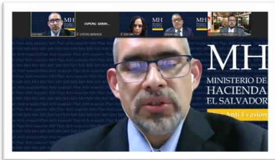
Webijnar Amnistía Fiscal, impartido de forma gratuita en beneficio de todos los regulados.