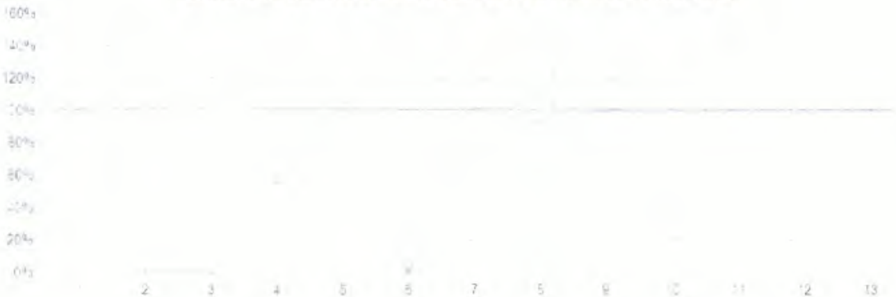
PORCENTAJE DE CUMPLIMIENTO DEL PLAN DE TRABAJO FONDO GOES