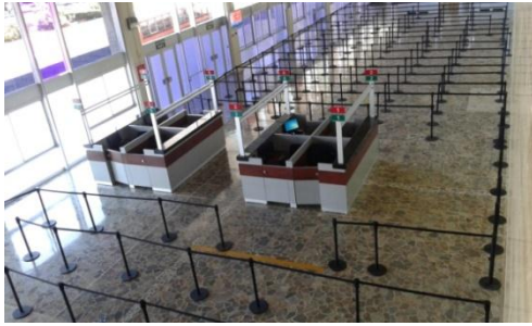
Área para Extranjeros