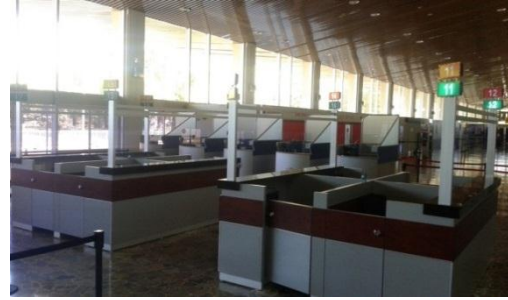
Área para Nacionales