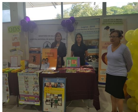
Stand de Oficina por el Derecho a la Salud