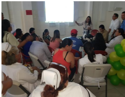
Trabajo en mesa