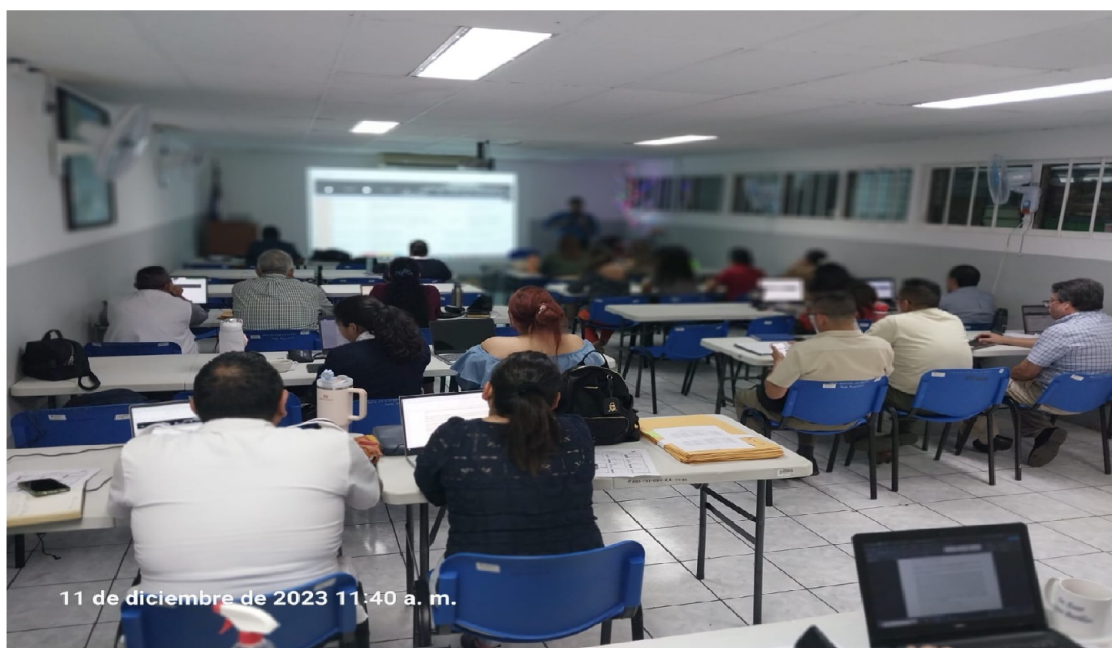
Reunión con equipos técnicos de región y SIBASI. Elaboración de Plataforma de Planificación 2024.

La Plataforma de Planificación Regional incluye en su estructura tres de los cuatro componentes del Modelo de Atención Integral de salud, organización, provisión y gestión; a continuación, se presentan estratificadas por cada nivel, las actividades principales que fortalecen el trabajo en red.