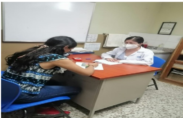
Atención psicológica individualizada USI San Rafael Cedros

Tasa de mortalidad por suicidio año 2023 fue de 1.58; 15 suicidios en el año.