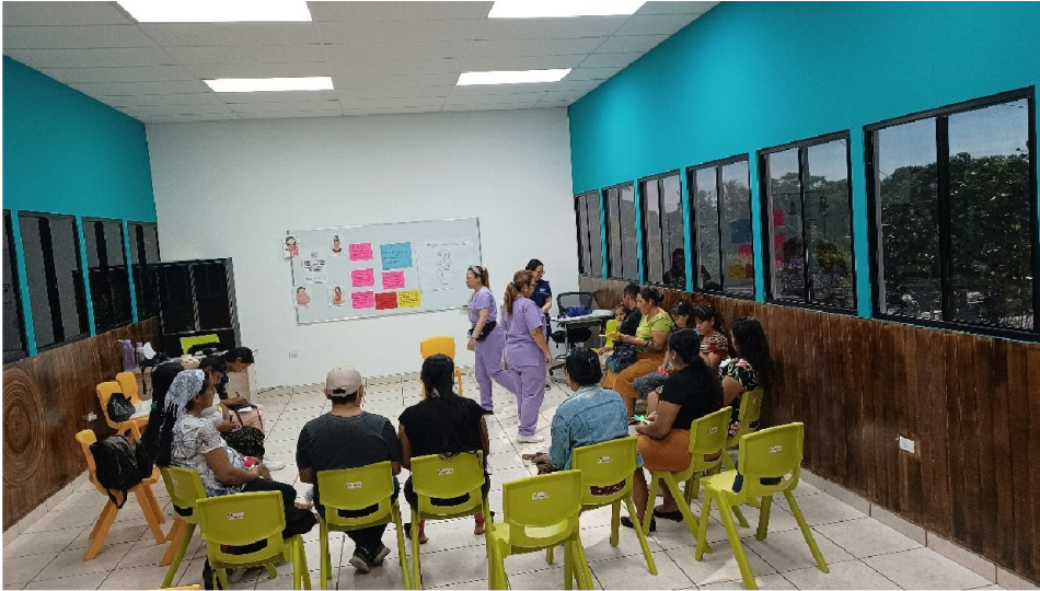
Desarrollo de sesión de educación prenatal, USI San Luis Talpa

Un total de 5,098 gestantes fueron detectadas por promotores de salud, el número de pasantillas hospitalarias realizadas fue de 84 con un total de 503 embarazadas participando. Se brindaron un total de 2,009 atenciones de preconcepción lo que equivale a 27.4% de embarazadas inscritas.