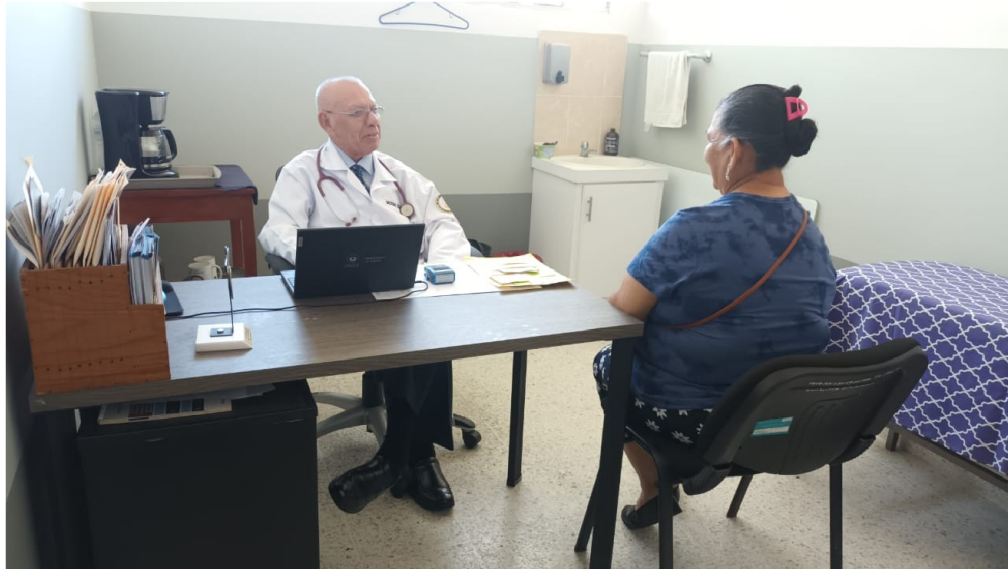
Atención de paciente con el módulo ENT de SIS