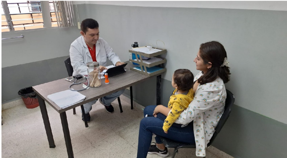
Atención infantil con uso de SIS

Se da continuidad a la dotación de equipo tecnológico para registro de consulta (tabletas y laptops) y de equipo tecnológico para redes de datos servidores, switch y regletas), fueron beneficiados 48 establecimientos de salud