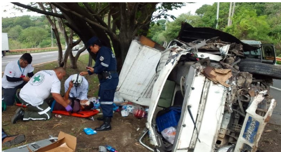
Accidente de tránsito ocurrido en año 2023, Carretera a Comalapa, La Paz

Aporte al alcance del resultado estratégico 2.3.9.8 Al 2025, se ha reducido a 5.21 la tasa de mortalidad por lesiones debidas a accidentes de tráfico por 100,000 hab