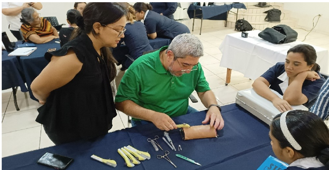
Capacitación en métodos de larga duración