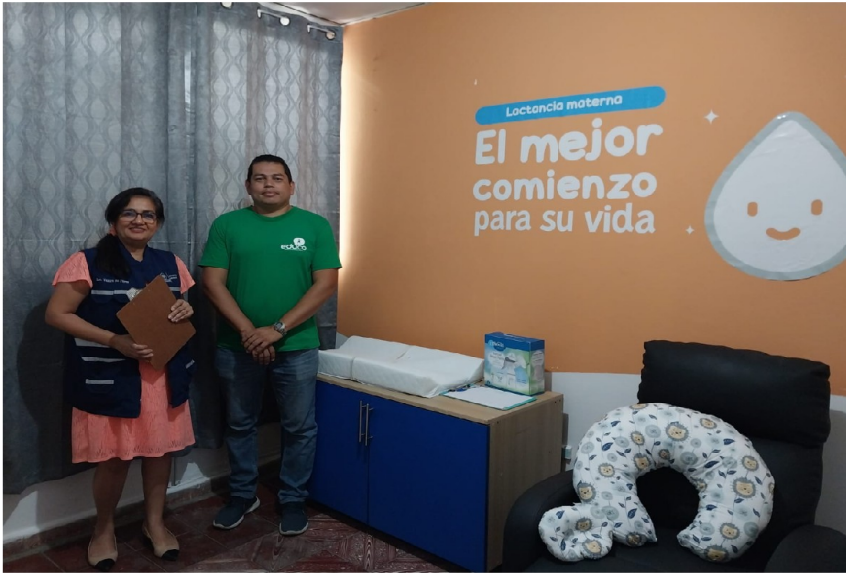
Sala de lactancia materna EDUCO