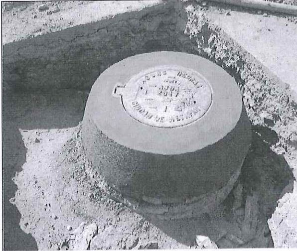
Fotografía de tapón de pozo de visita con bisagra