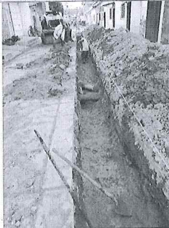
Regado de material selecto para su posterior compactación.