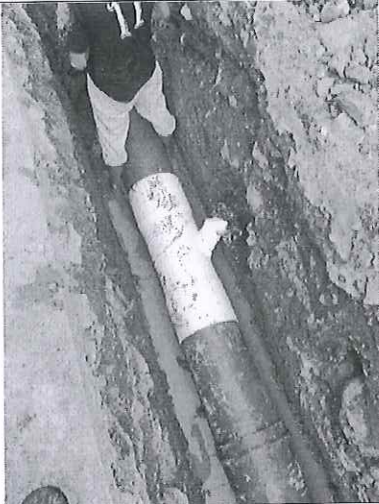
Instalación de "Yee -Tee" para conexión de acometida