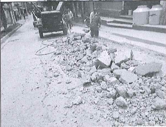
Rotura de concreto en el frente de la Calle Central