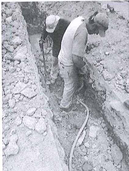
Demolición de estrato rocoso con equipo hidroneumático