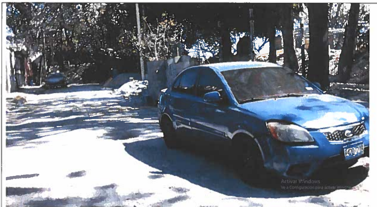
La misma vista, con otra fecha distinta, el lado poniente está libre de circulación.