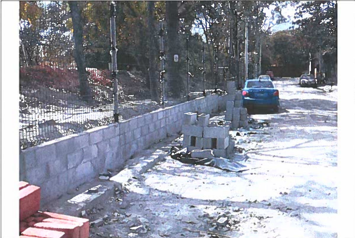
Bloque agotándose en la existencia. Se aprecia el vehículo estacionado, no hay obstáculo que impide circulación