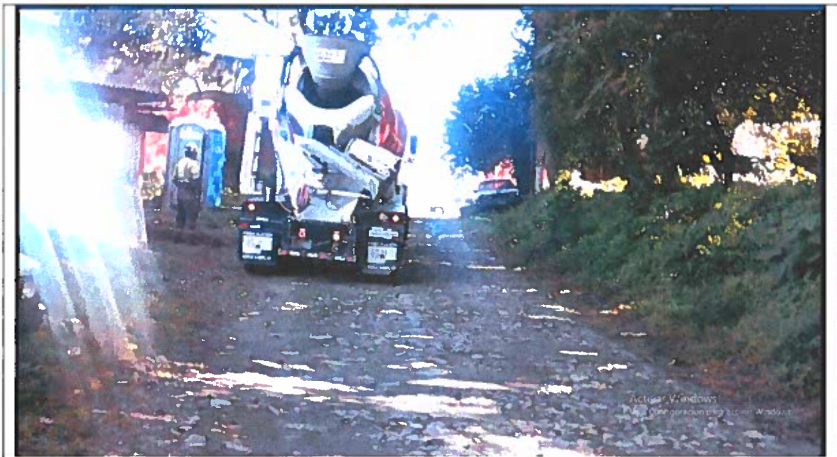
Camión revolvedor, dejando libre la movilidad vehicular.

Efectivamente se trabajó en dos domingos (13/10/19 y 27/10/19), lo cual fue comunicado oportunamente al administrador de contrato. La programación estaba sujeta a la disponibilidad del proveedor. De parte del realizador se comunicó a los colindantes para que permitieran dejar una vía libre para el aparcamiento temporal de los camiones que suministraron el concreto, se dejó un carril para circulación, tal como se aprecia en las siguientes fotografías.