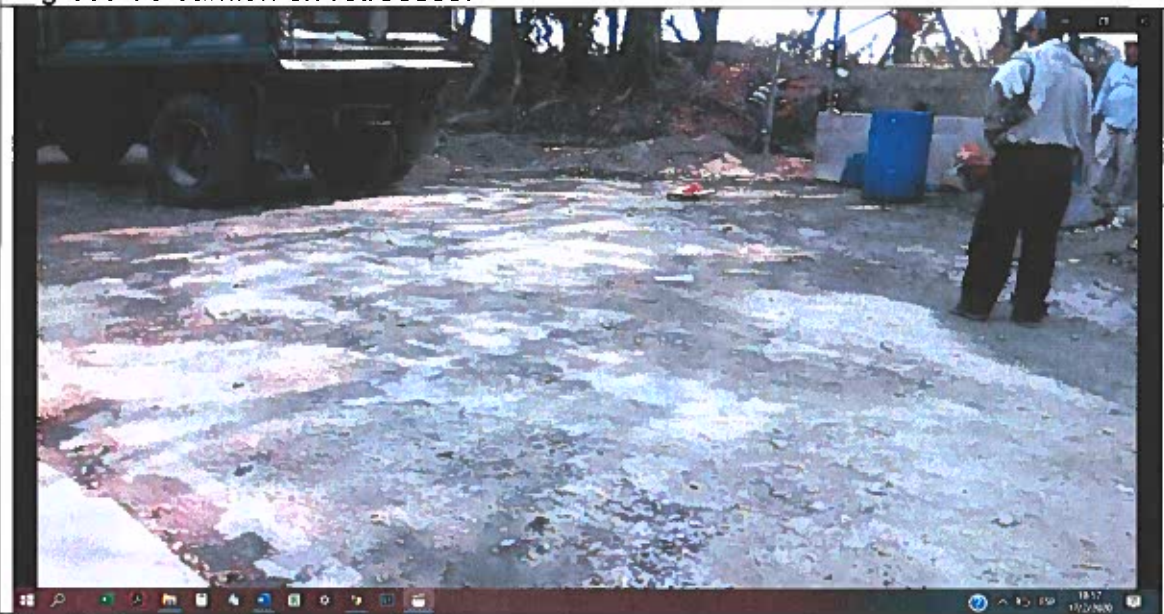
Continúa acercándose al sitio de acopio.