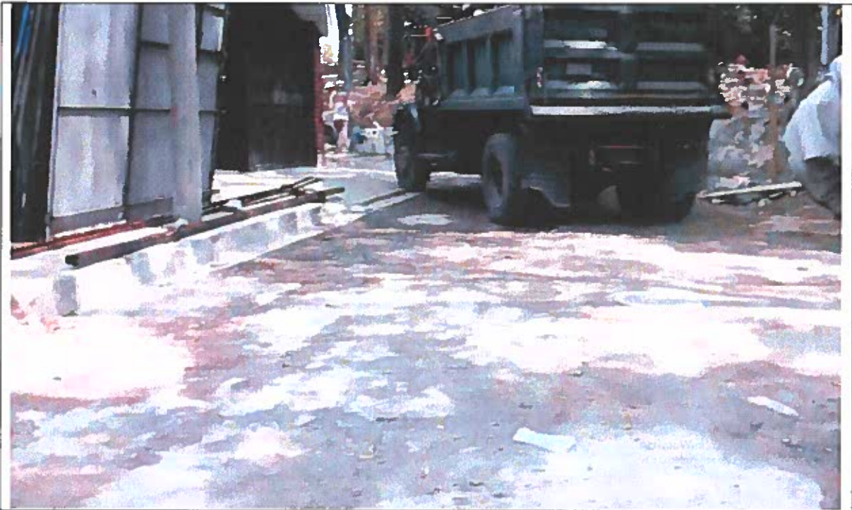
Ingreso de camión en retroceso.