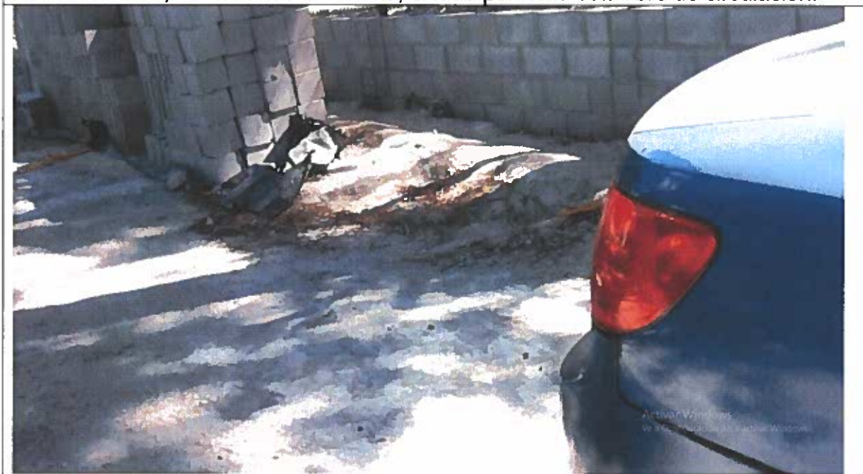
Esta vista corresponde a la distancia prudencial, entre el vehículo y el bloque acopiado.