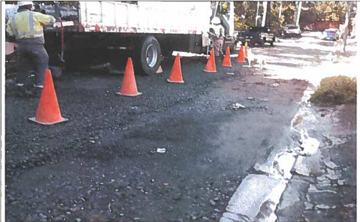
Camión con equipo: tuberías, abrazaderas, entre otros, dejando libre movilidad de un carril vehicular.