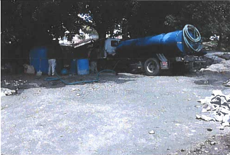
Otra foto, cuando no se había construido la rampa de acceso, el camión cisterna ingresaba hasta adentro, con el fin de no estorbar el pasaje vehicular.