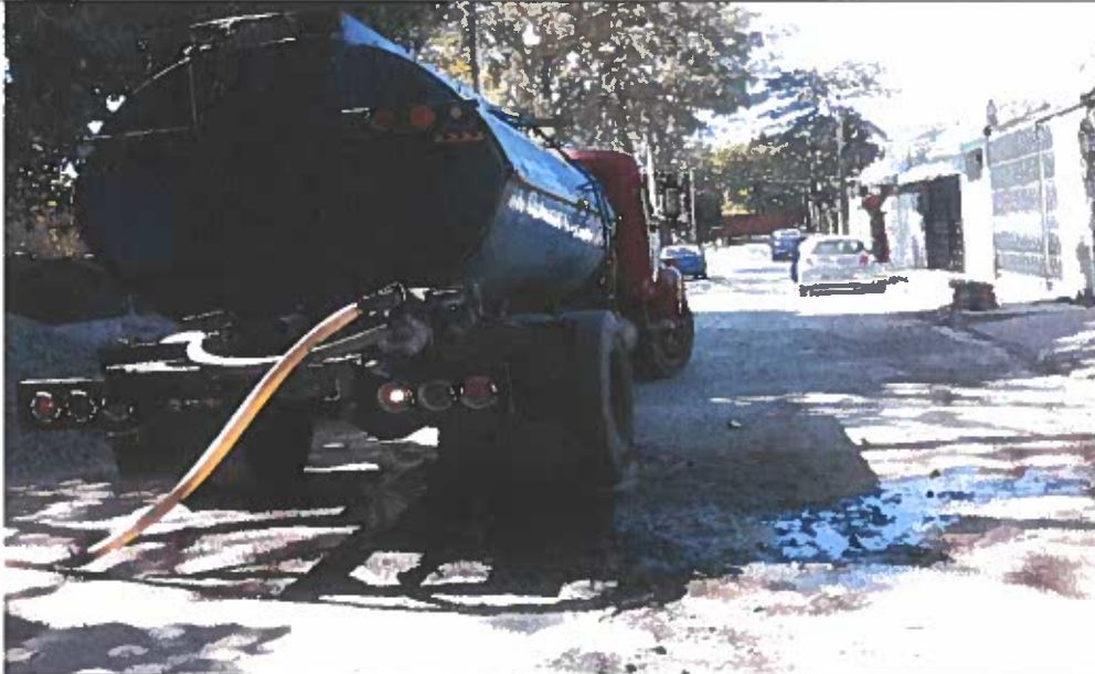
Camión tipo cisterna, con agua potable, a la derecha se aprecia libre movilización vehicular.