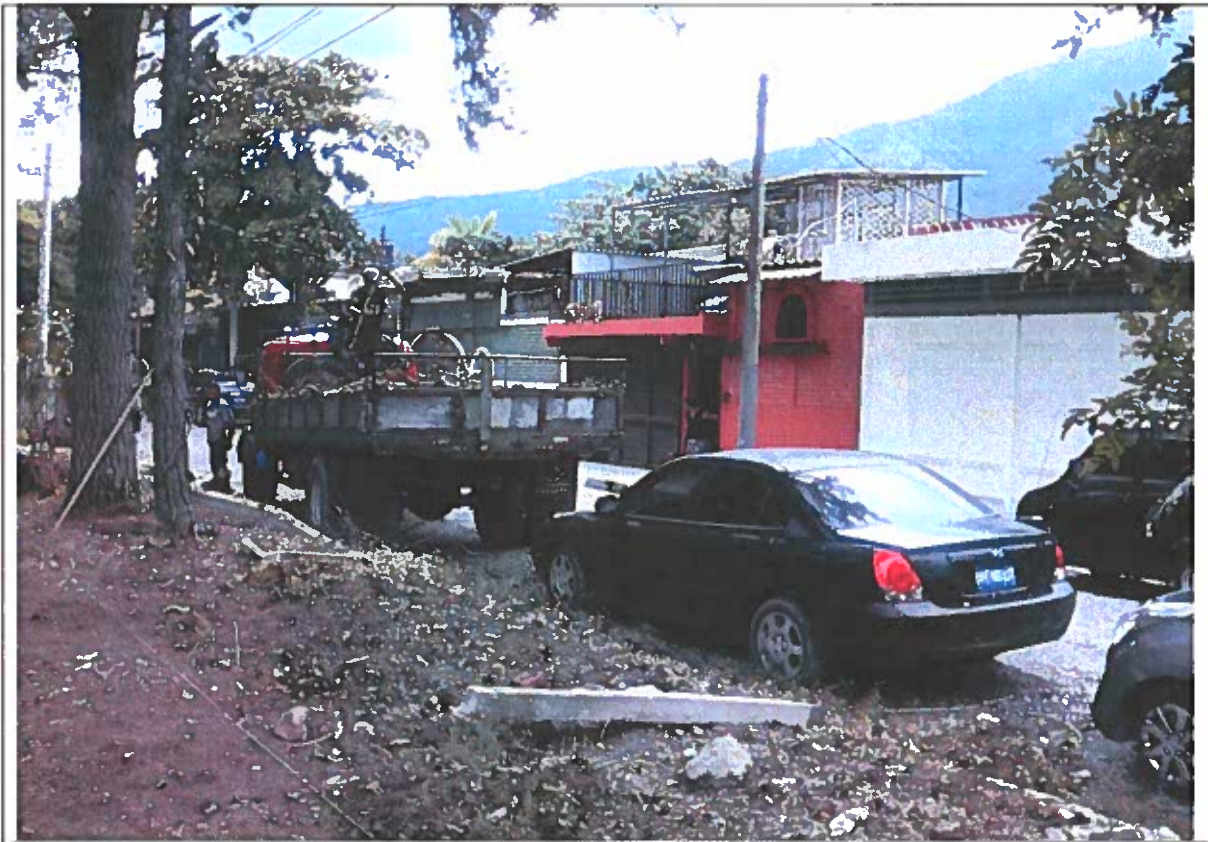
Camión de estaca apartado, para llevar desalojo, se observa el espacio dejado para movilización de los vehículos.