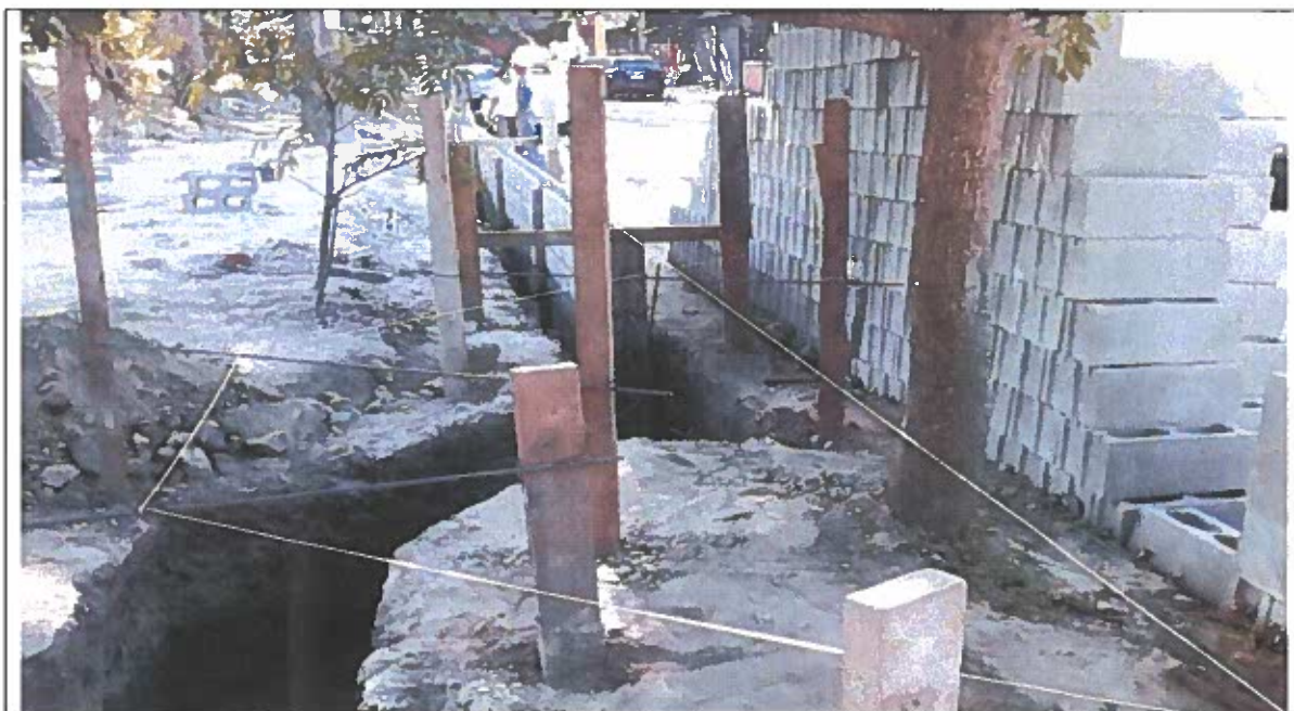
Bloques acopiados en costado oriente.

El ancho del pasaje al inicio del pasaje permite que dos vehículos circulen en paralelo, mientras que después de la primera vivienda se pueden tener parqueados dos vehículos (al costado oriente y otro al poniente) y un tercero que pueda movilizarse al centro. El espacio que se ha utilizado para el acopio de bloques, arena, piedra, entre otros, ha sido en parte en el costado oriente, algunas fotografías se presentan para ahondar sobre este aspecto.