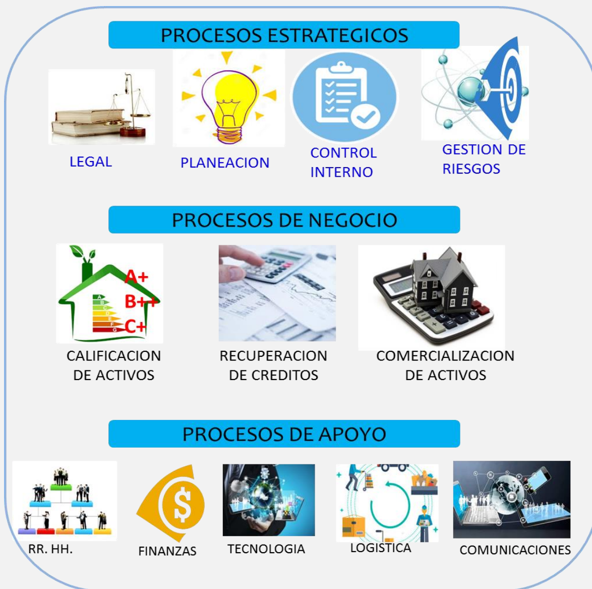
Gráfica No. 4 Infografía de mapa de procesos de FOSAFFI.

A finales de 2017 se autorizó en la CA 49/2017 el nuevo mapa de procesos, ordenando la siguiente jerarquía de procesos: