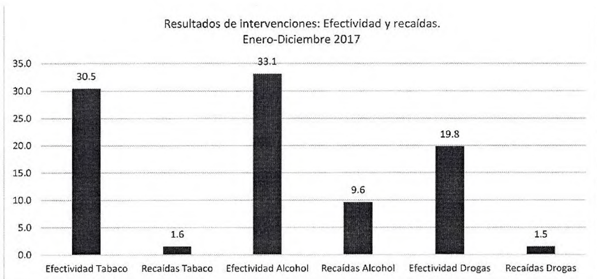
Gráfico 1. Resultados de intervenciones: Efectividad y recaídas. Enero-diciembre 2017