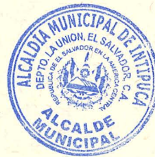
Sr. José Elenilson Leonzo Gallo Alcalde Municipal Alcaldía Municipal de Intipuca