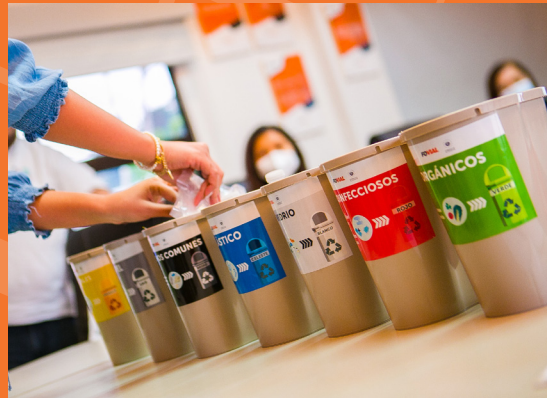
En FOVIAL estamos aprendiendo a separar nuestros desechos y a contribuir al reciclaje.