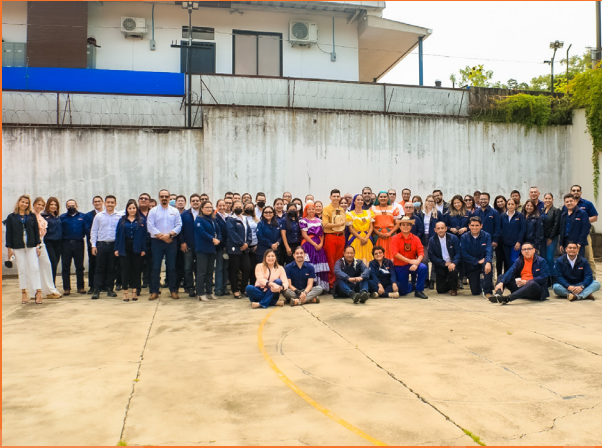
Conmemoramos 201 años de Independencia acompañados del ballet folkórico de Nejapa.