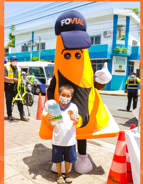
FOVIALITO inauguró el plan vacacional para la seguridad de los usuarios en Surf City.