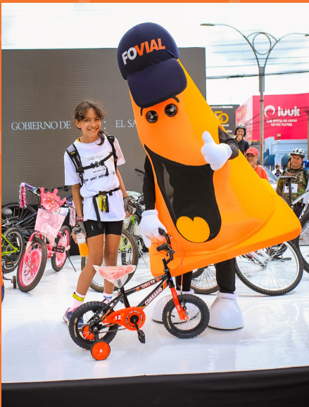
Pedaleada en ciclovia Hipodrómo.