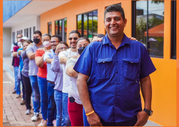
Taller de ética.