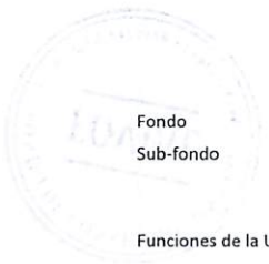
TABLA DE PLAZOS DE CONSERVACIÓN DOCUMENTAL