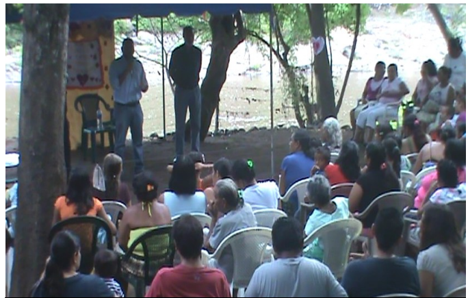
Celebración del mes de la madre en comunidad Santa Leonor, cantón el presidio.