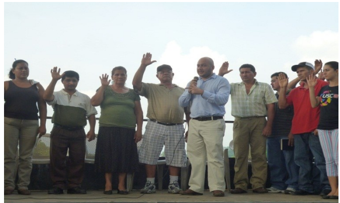
Reunión y juramentación la comunidad de Apancoyo.