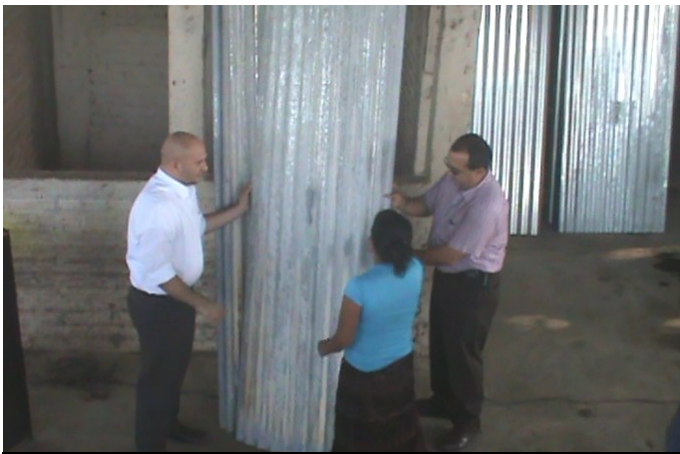
Entrega de láminas en Cantón Metalío municipio de Acajutla.