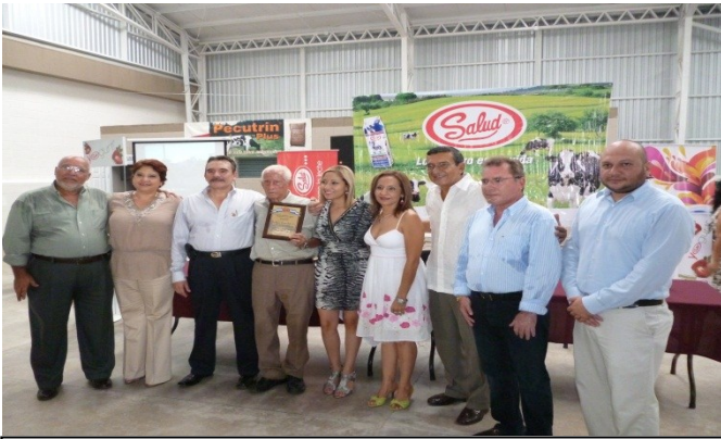
Lanzamiento e inauguración de nuevas instalaciones de planta procesadora de Yogurt.