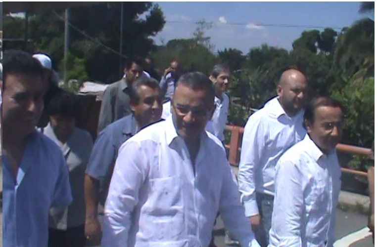
Visita técnica del Sr. Presidente de la República Carlos Mauricio Funes ,Sr. Ministro de Obras Públicas Gobernador Departamental de Sonsonate y Técnicos extranjeros y otras autoridades para reconstrucción de puente de ateos por la tormenta 12-E