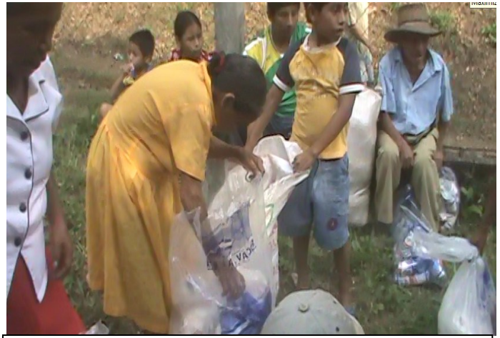
Entrega de Víveres en el municipio de Nahuizalco comunidad Sabana Grande el día 15 de noviembre después de la tormenta 12-E.