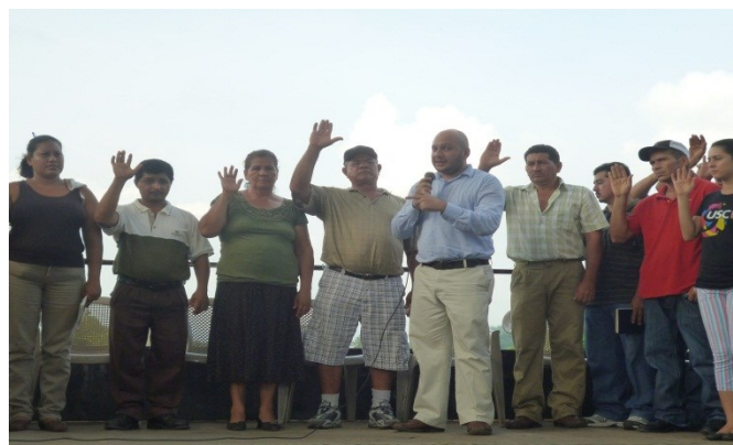
Reunión y juramentación la comunidad de Apancoyo.