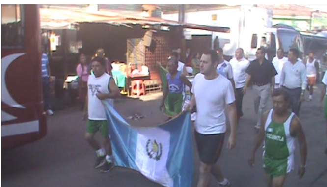
Presentación de colegio Salarrué en círculo estudiantil.