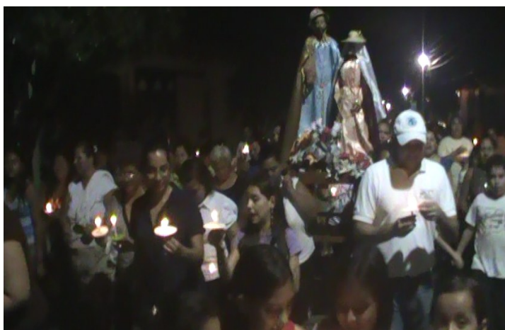
Realización de posada con la comunidad del barrio el Pilar y colonia Santa María.