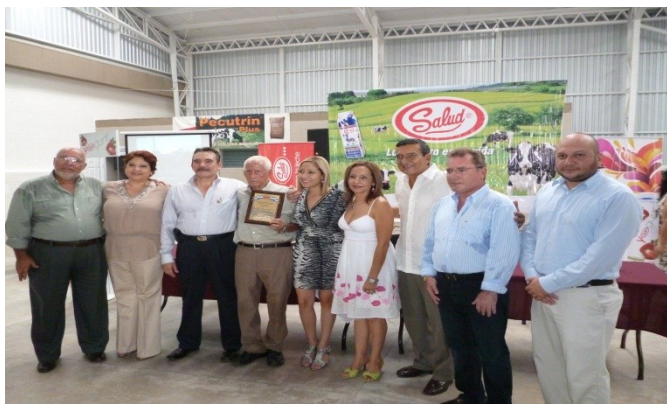
Lanzamiento e inauguración de nuevas instalaciones de planta procesadora de Yogurt.