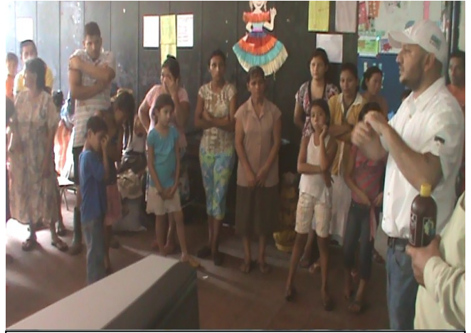
Entrega de Víveres en el municipio de Sonsonate en comunidad los viveros a personas albergadas por la tormenta 12-E