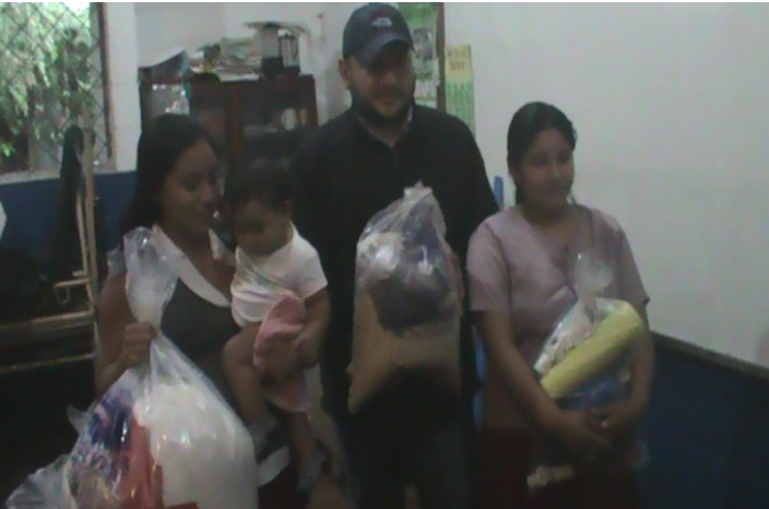
Entrega de Víveres en el municipio de Nahuizalco el 12 de octubre por la tormenta 12-E