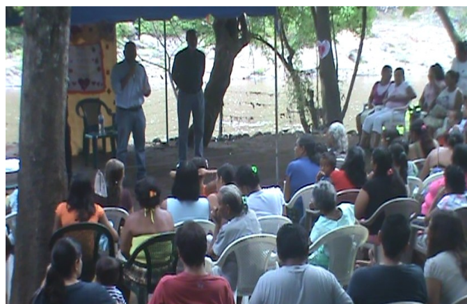
Celebración del mes de la madre en comunidad Santa Leonor, cantón el presidio.