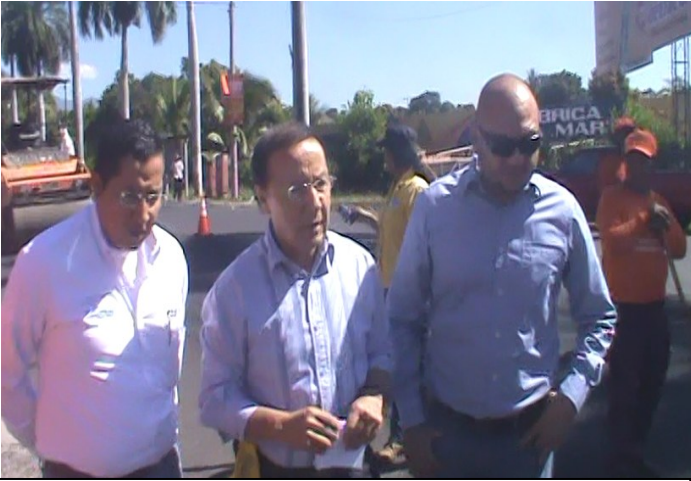
Inicio de rescate de Av. Ramirez Quiñonez 28 de noviembre.