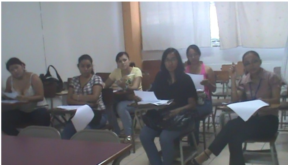
Capacitación de alumnas de la Universidad Dr. Andrés Bello para realización de Censo de Necesidades Alimenticias Tormenta 12-E