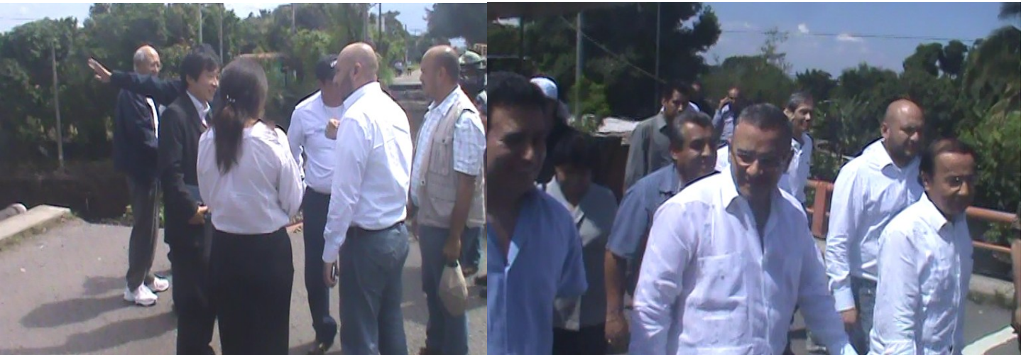
Visita técnica del Sr. Presidente de la República Carlos Mauricio Funes ,Sr. Ministro de Obras Públicas Gobernador Departamental de Sonsonate y Técnicos extranjeros y otras autoridades para reconstrucción de puente de ateos por la tormenta 12-E