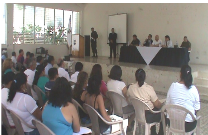
Rendición de Cuentas PNC Acajutla