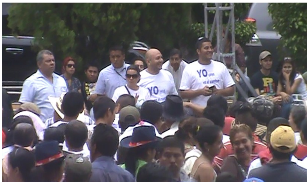
Acto de Apoyo a los 3 años de gestión del Presidente Funes.