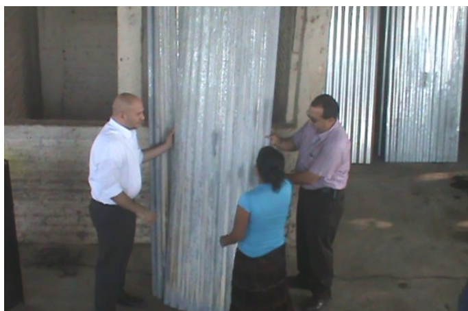
Entrega de láminas en Cantón Metalío municipio de Acajutla.