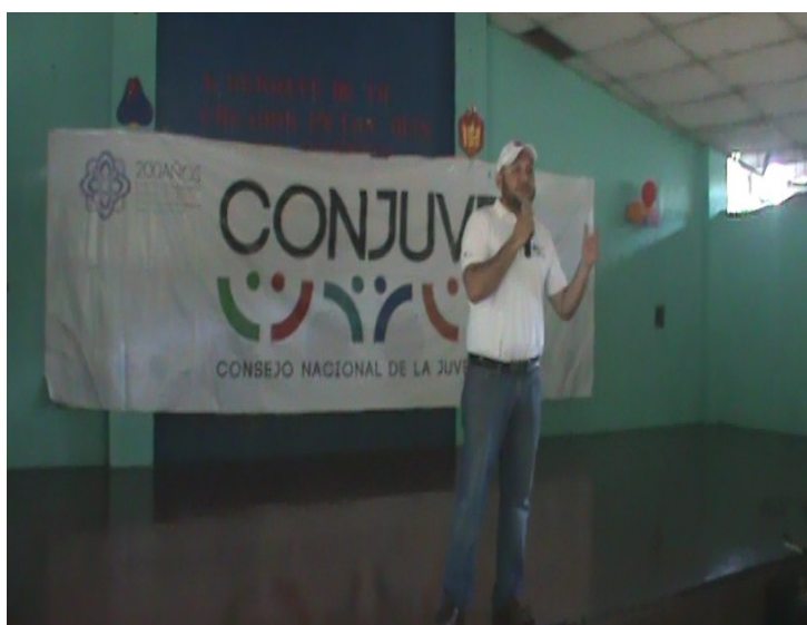
Clausura de Talleres vocacionales apoyando a CONJUVE