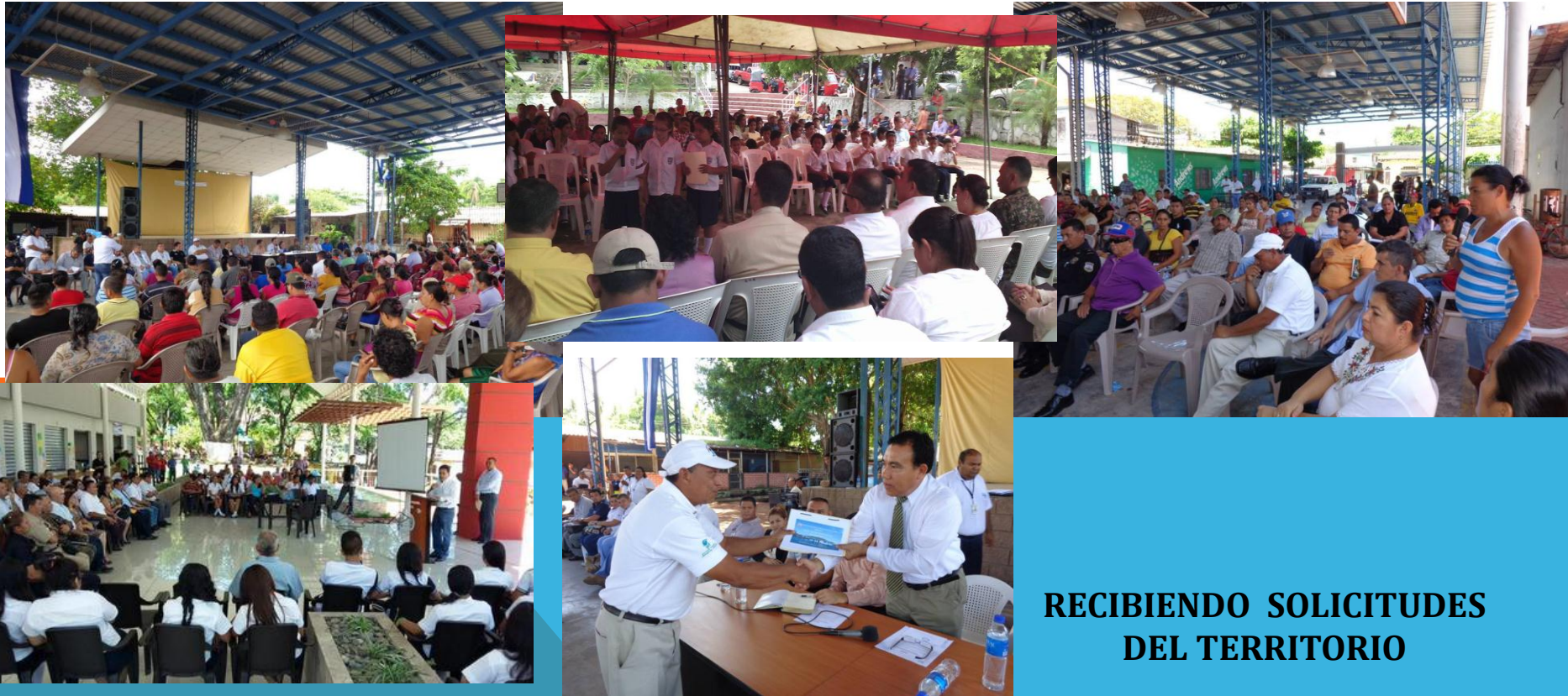
RECIBIENDO SOLICITUDES DEL TERRITORIO