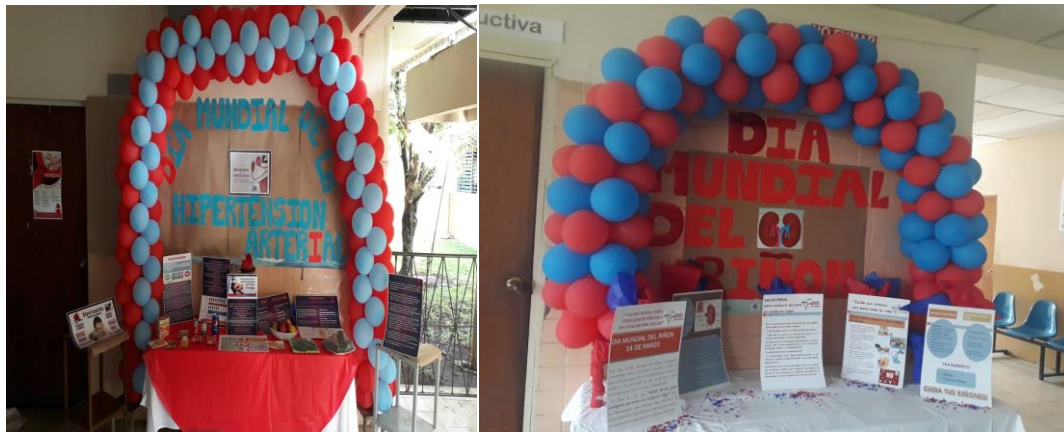
Actividades en Promoción en Salud. Celebración día de la Hipertensión y del Riñon