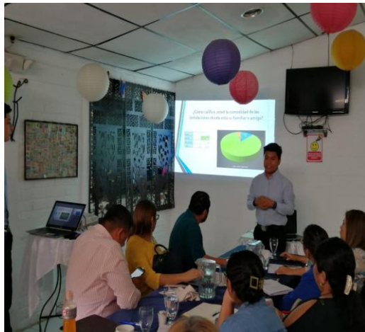
Participación social. Realización de encuestas de satisfacción y exposición de resultados a Consejo Estratégico de Gestión