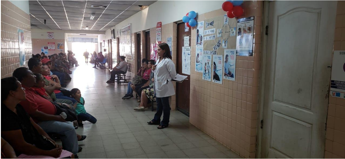
Fortalecimiento en promoción y Educación en Salud con Recurso Humano Calificado