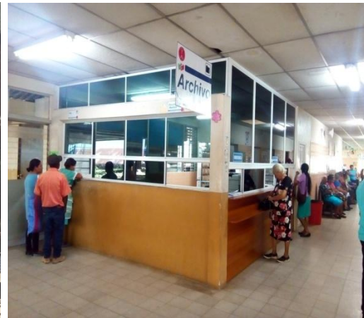
Desarrollo en la atención del paciente ambulatorio. Agendamiento de citas