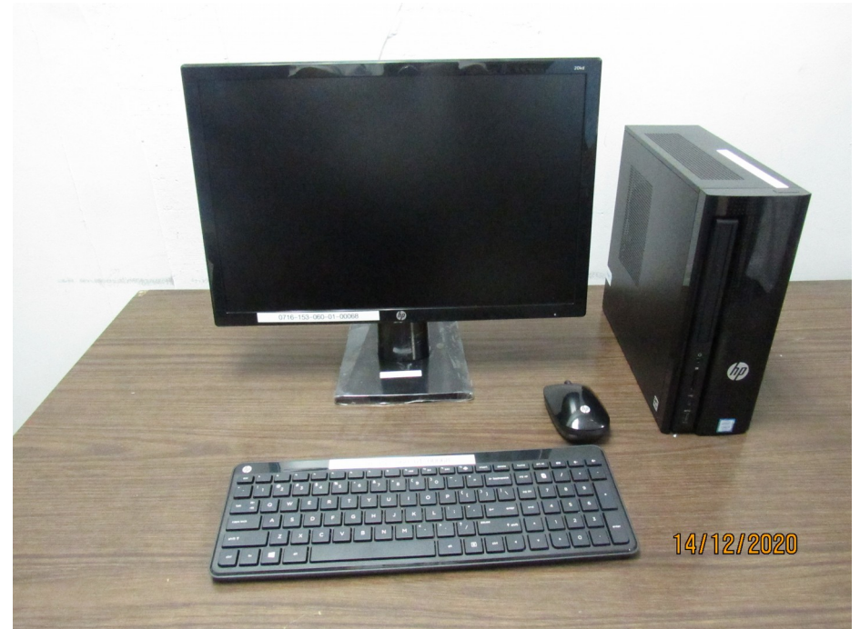
Compra de equipo informático