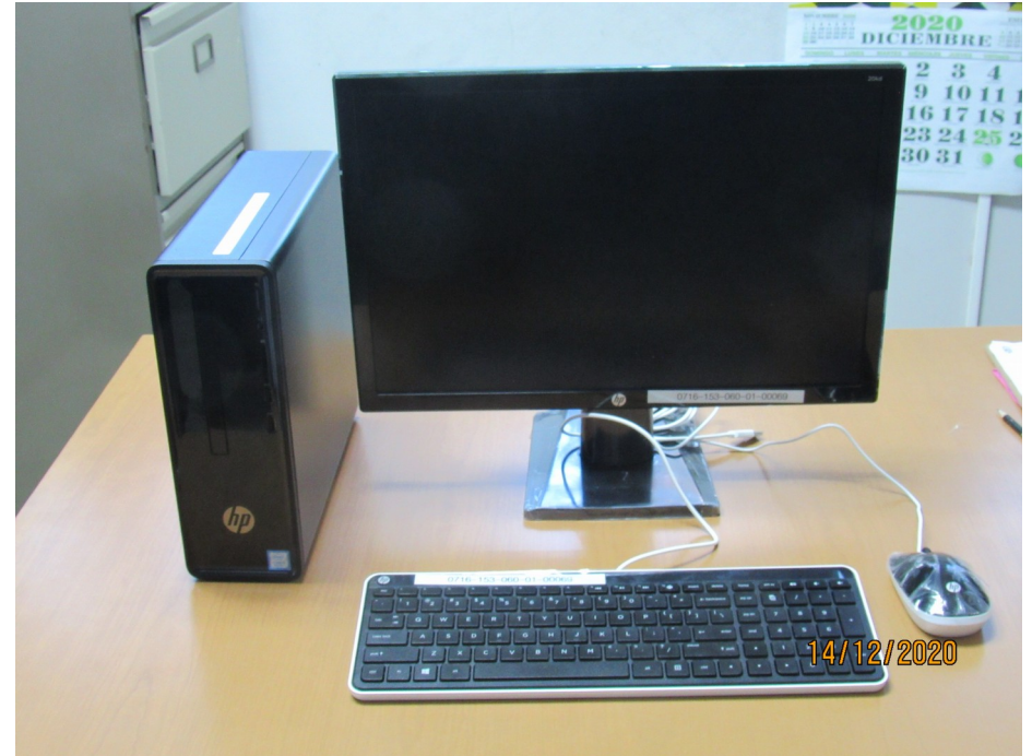
Compra de equipo informático