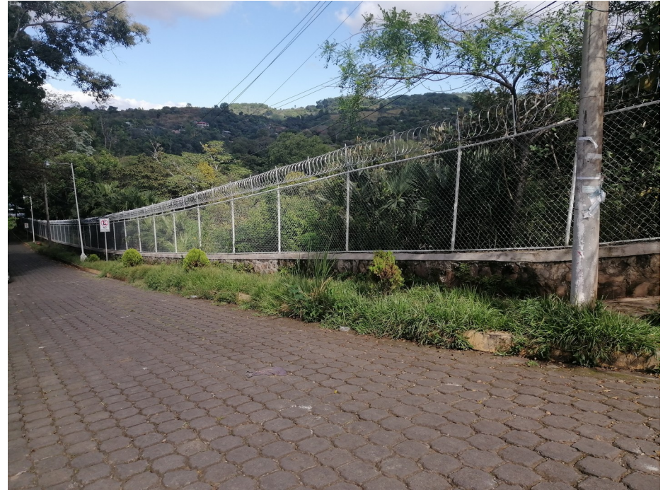
Construcción de muro perimetral