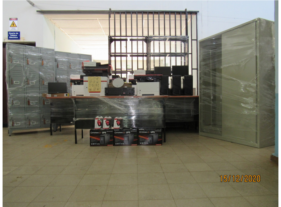
Compra de equipo informático