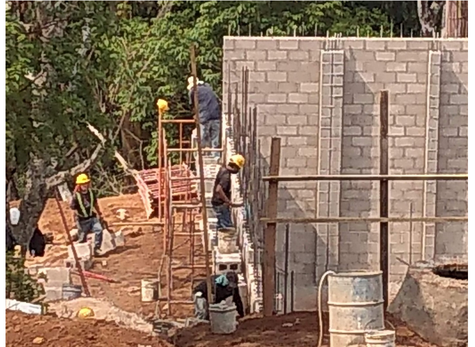
Construcción de muro perimetral