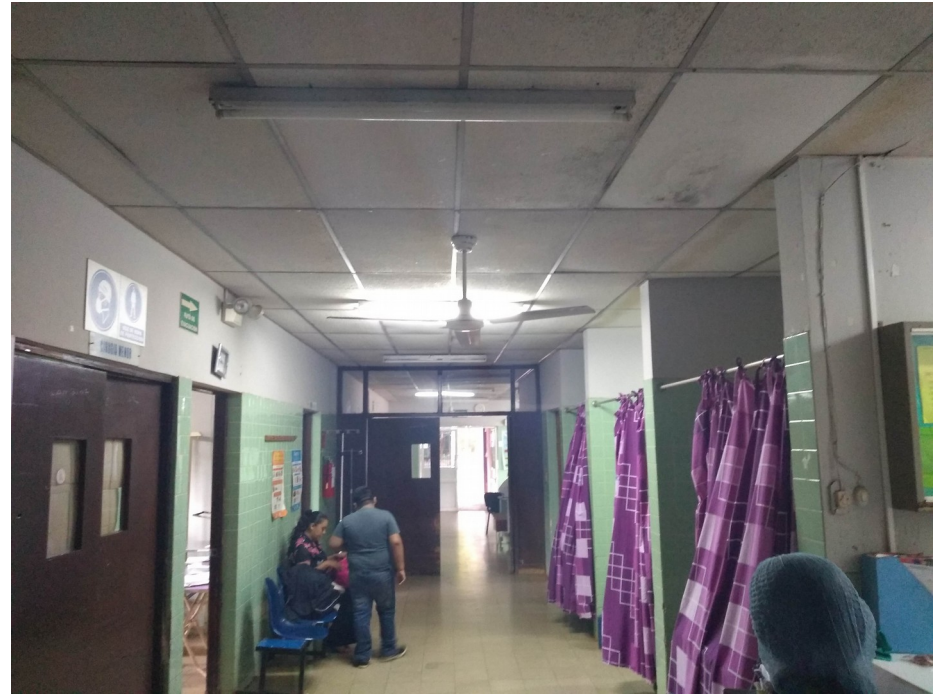
Cambio de cielo falso