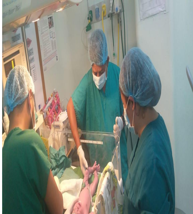
Atencion a Recien Nacido