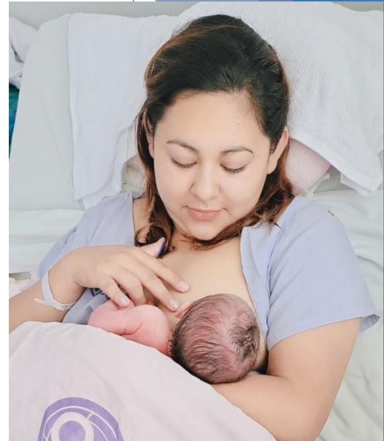
Lactancia materna exclusiva