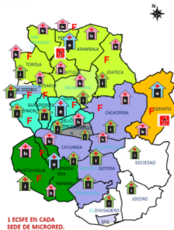
19 municipios intervenidos 2010-2012