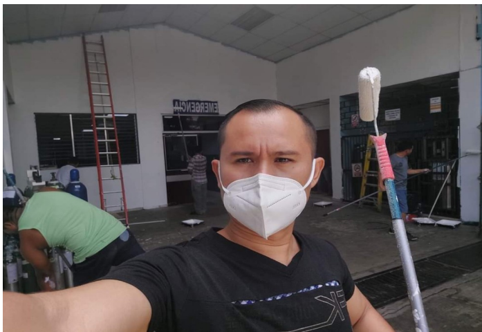
Restauración de pintura en las áreas del Hospital Nacional de