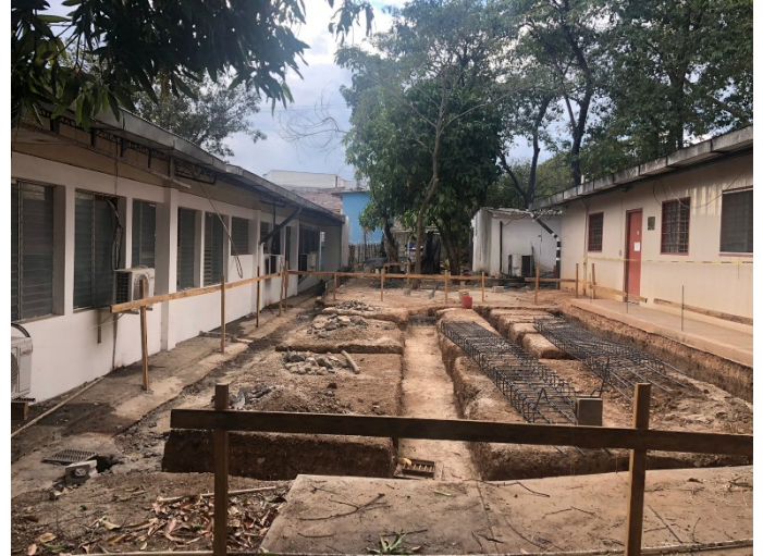
Equipo de Ultrasonografía