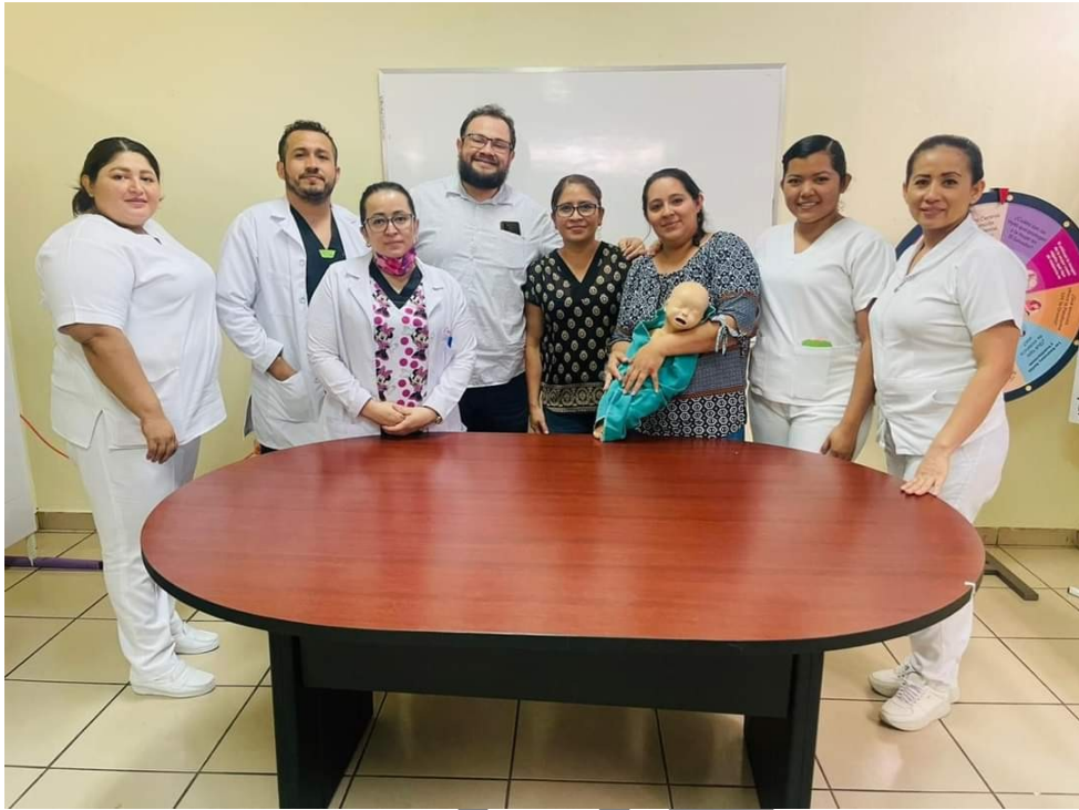
Curso de Reanimación Neonatal 2023