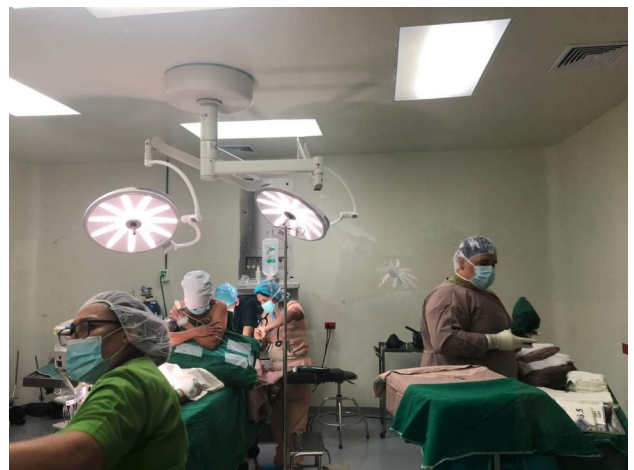
Instalación de lámparas en Sala de Operación