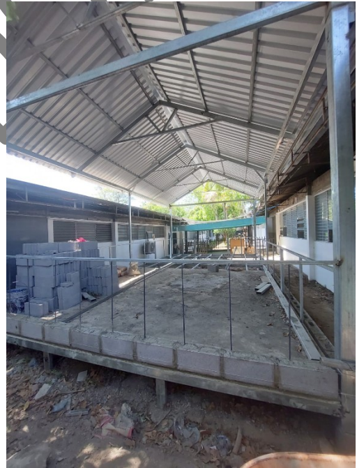
Clinica de Veretano de Guerra