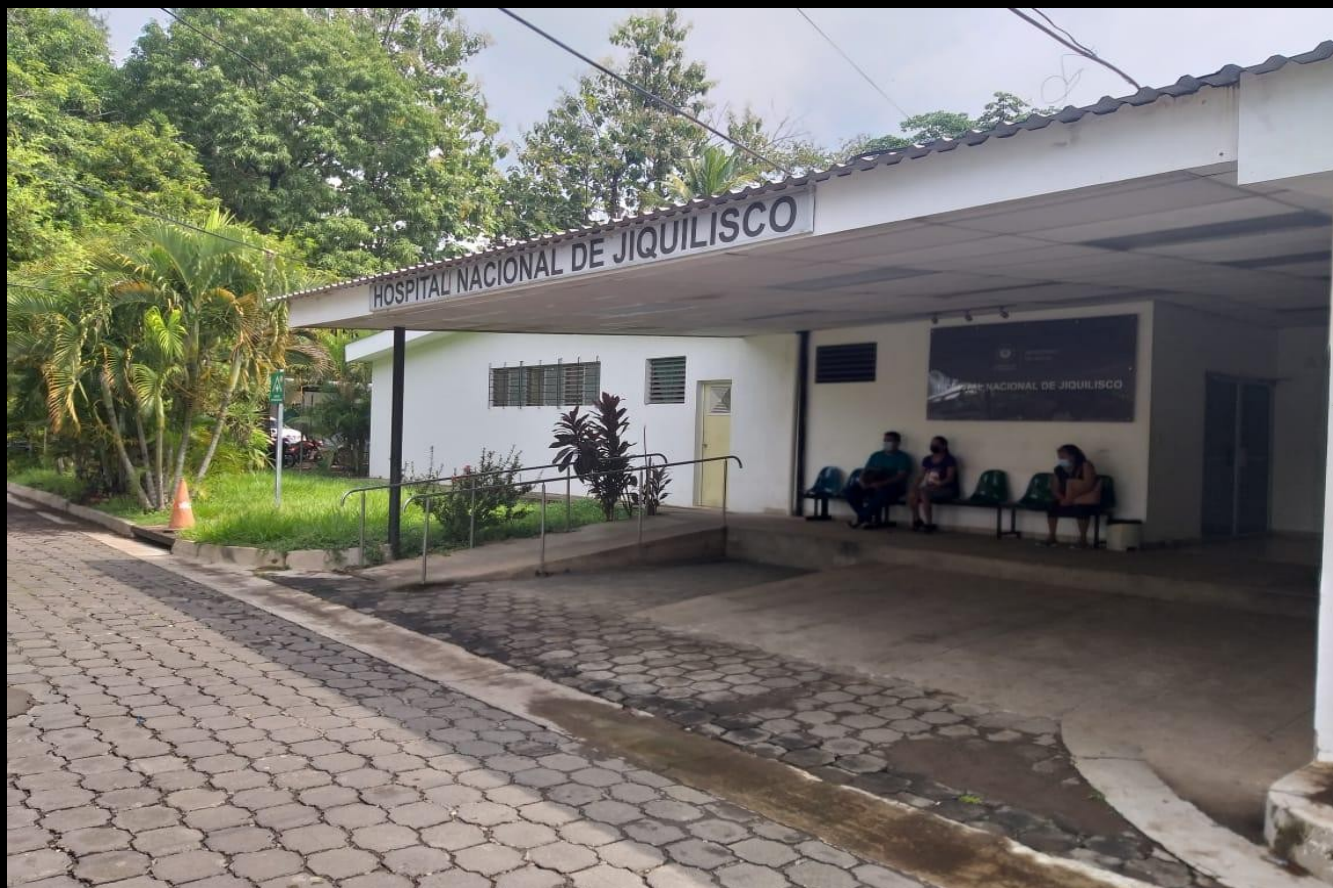
Jiquilisco, octubre 2022