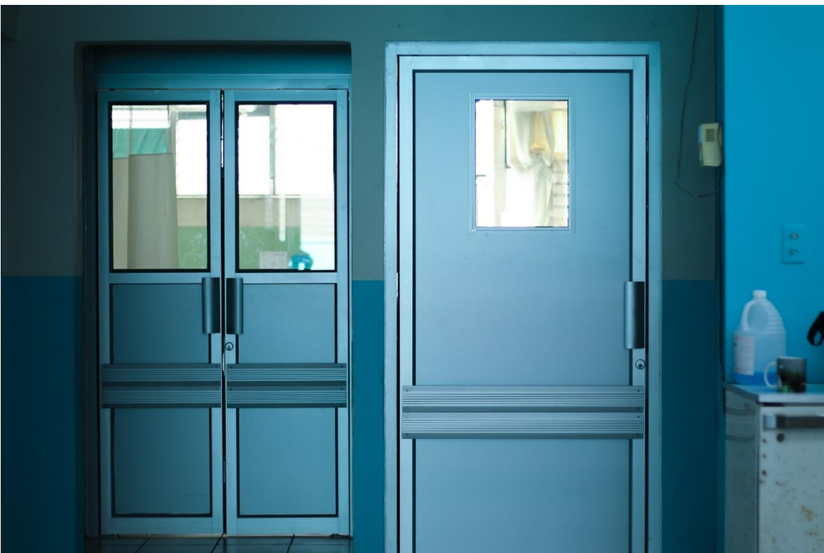
Puertas divisoras entre Máxima y Observación (emergencia)