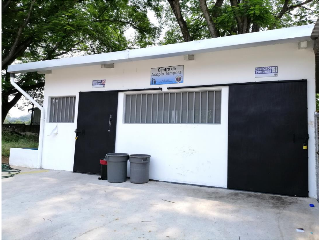
Construcción de un centro de acopio temporal el cual cumple con los requisitos técnicos recomendados.