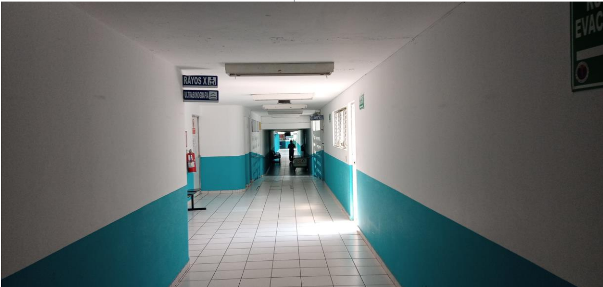
Pasillo entre consulta Externa/Emergencias y Hospitalización (pintura nueva diciembre 2019)