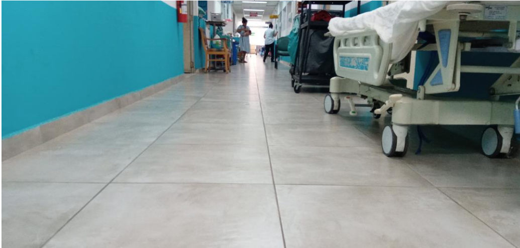
Pasillo con piso nuevo de Alto Tráfico de durabilidad de más de 10 años de Hospitalización diciembre 2019