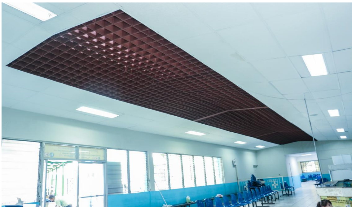
Área de consulta externa del Hospital de Metapan