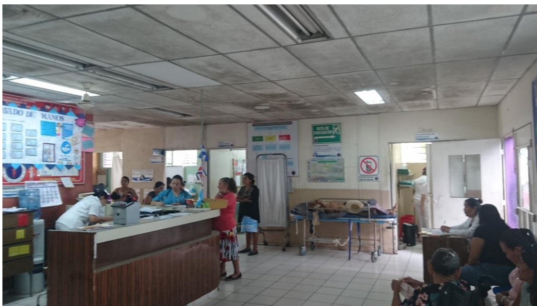
Fotografía en la Unidad de emergencias (agosto 2019)

A continuación, se presenta una serie de fotografías comparativas: