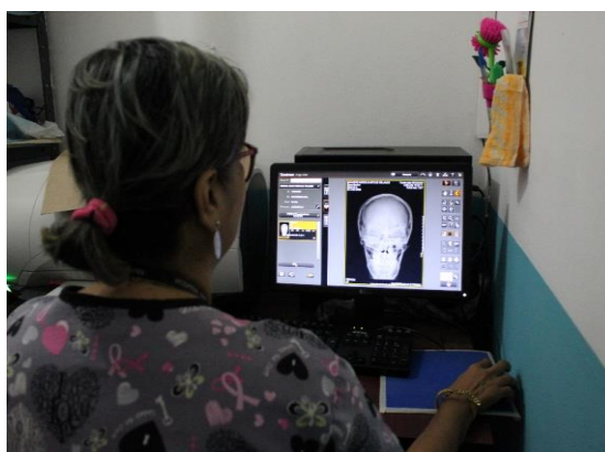
Personal de rayos X realizando impresión de la radiografía tomada