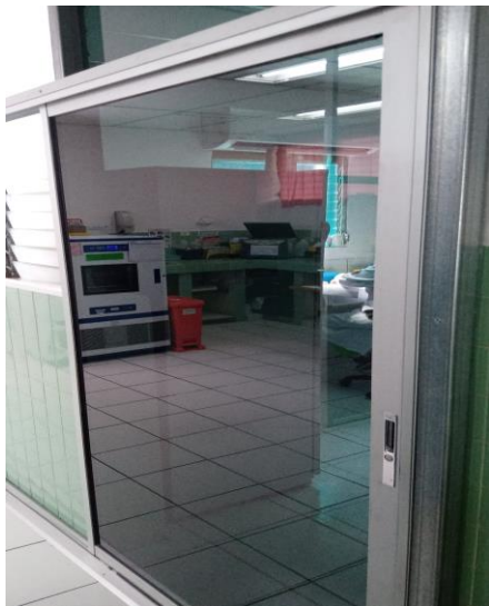
Puerta de entrada al área de bioquímica para segregación de áreas de trabajo.