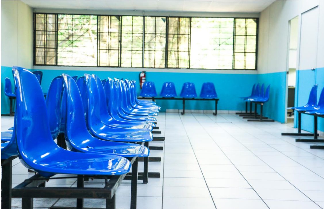
Área de consulta externa del Hospital de Metapan