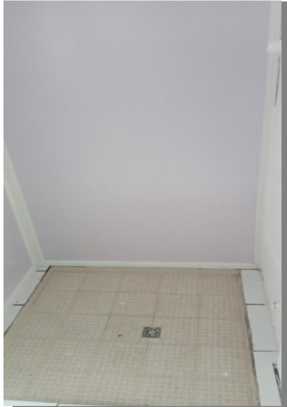
Ducha para retiro de contaminantes y bioinfecciosos para el personal de Laboratorio Clínico