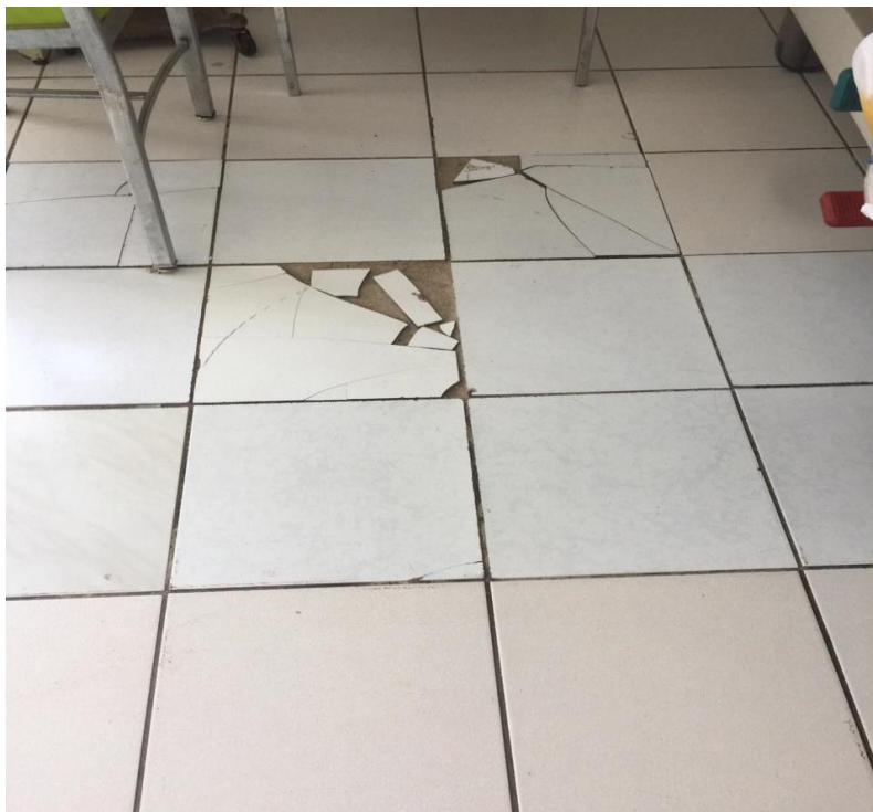
Estado del piso anteriormente (agosto 2019)