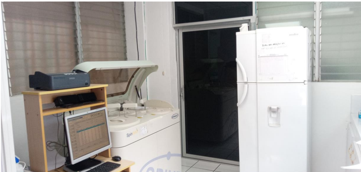
Área de laboratorio para la producción de bioquímica