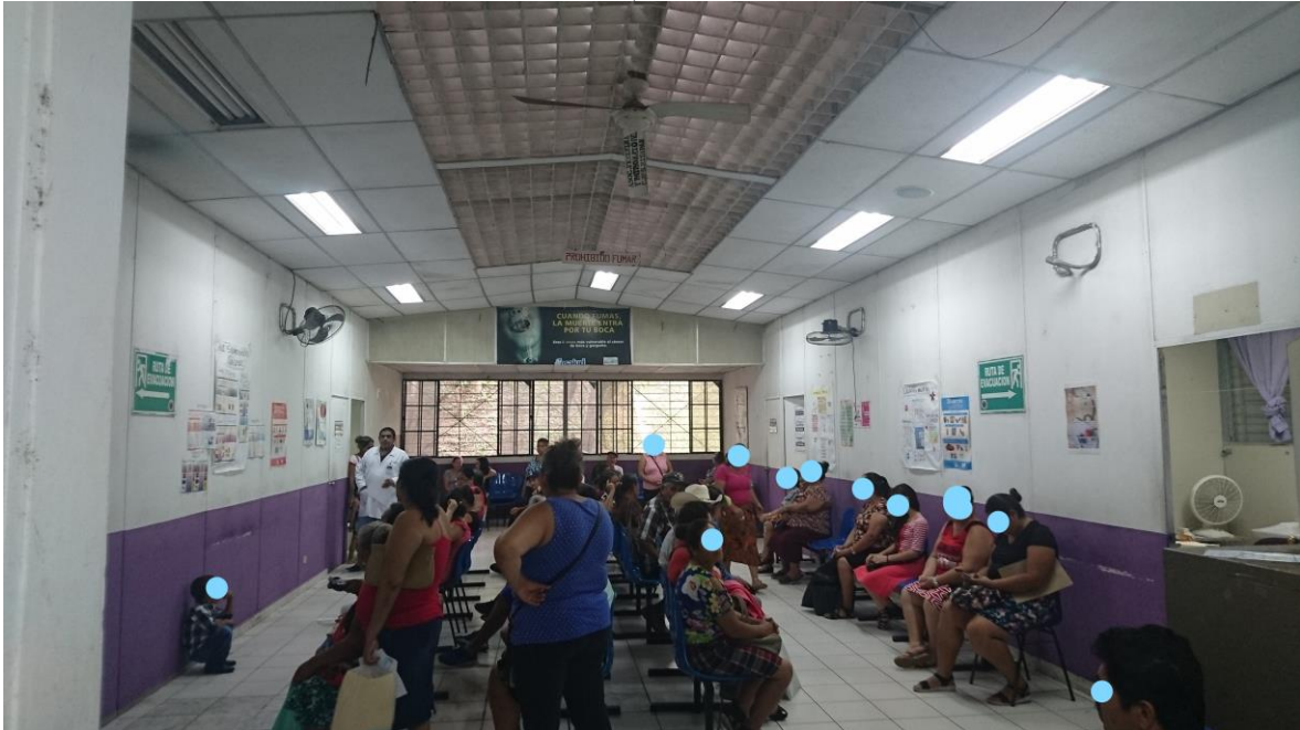
Fotografía (consulta Externa) Julio 2019