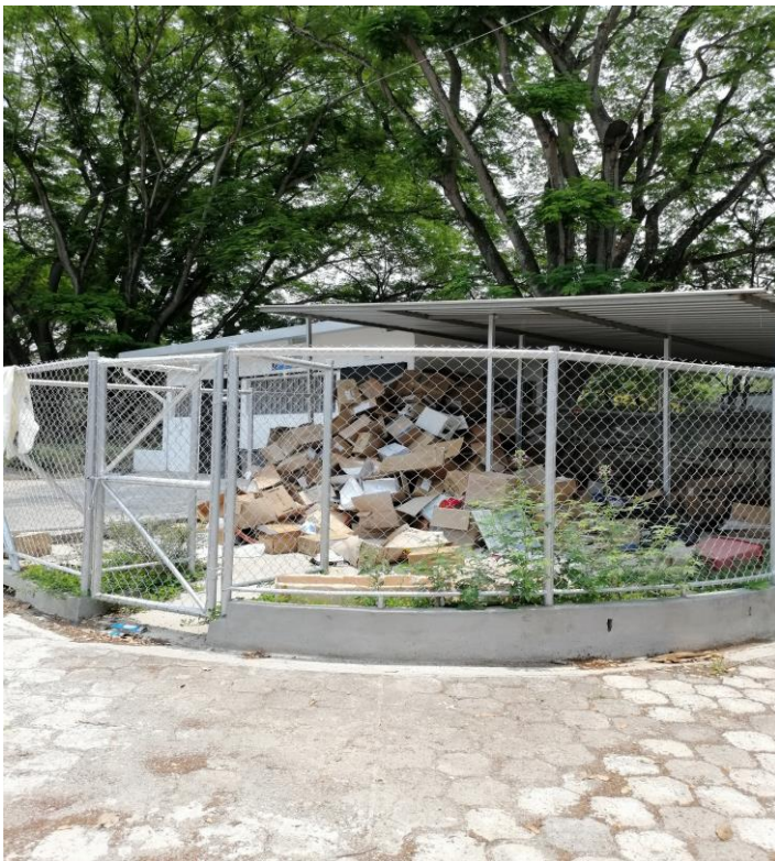
depósito de acopio temporal