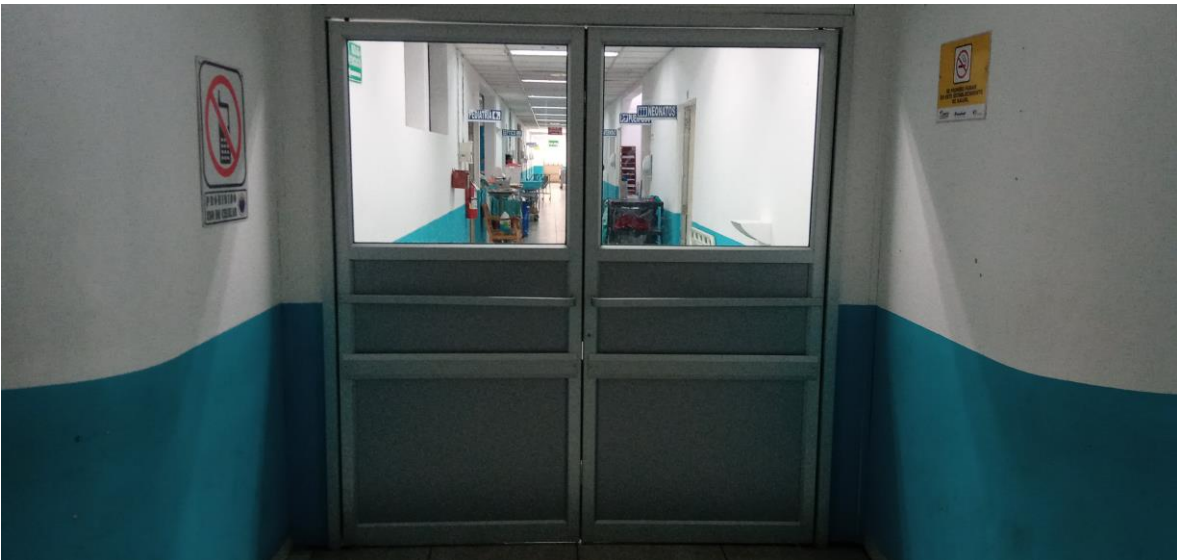
Puerta de acceso a las áreas de hospitalización