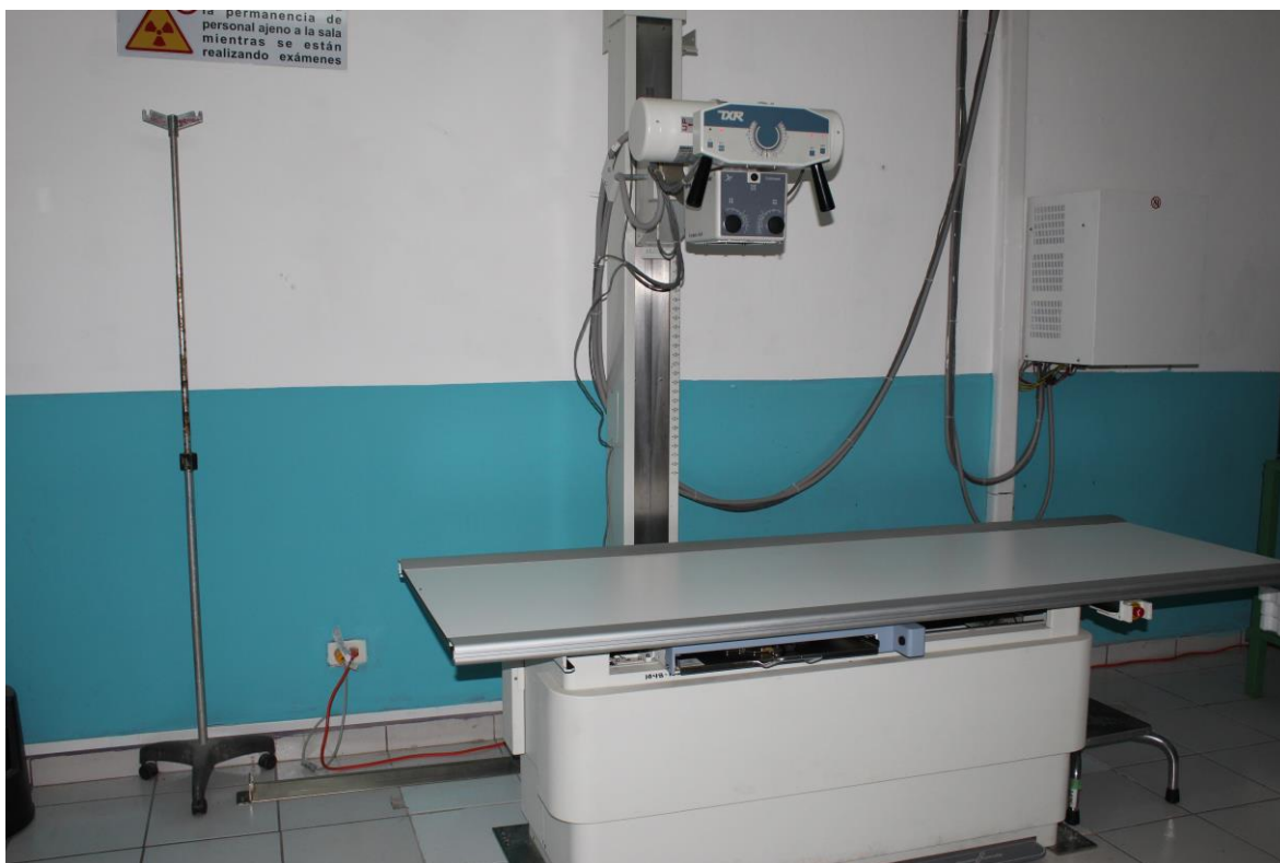
Equipo de rayos X actualmente instalado.

Se realizaron acciones en el Ministerio de Salud, la dirección del Hospital para la obtención de un equipo de Rayos X moderno el cual suplanta al equipo antiguo (uno de los más antiguos del País) Se realizaron acciones para trasladarlo desde la región oriental, anudado a eso se compró una procesadora moderna y funcional para la impresión de las radiografías