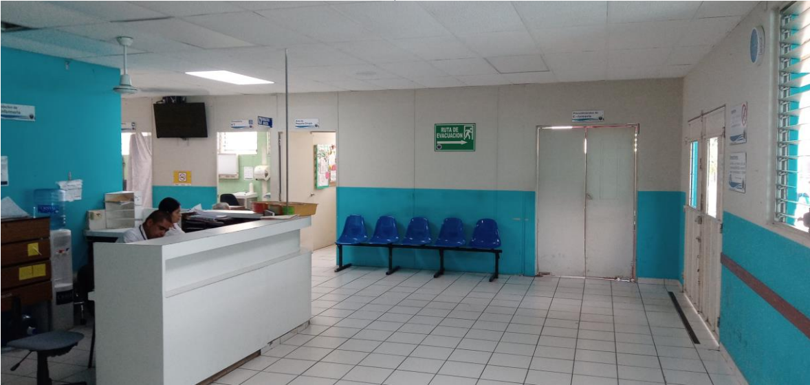
Fotografía de la emergencia (diciembre 2019)