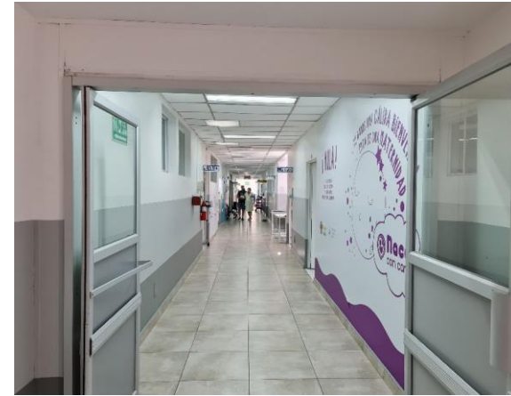
PASILLO DE HOSPITALIZACION