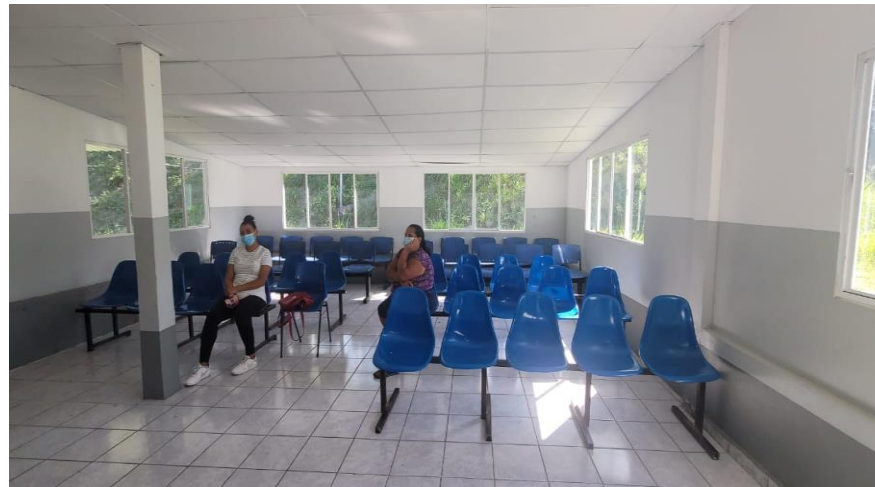
DURANTE LA REMODELACION AREA DE HOSPITALIZACION MATERNO