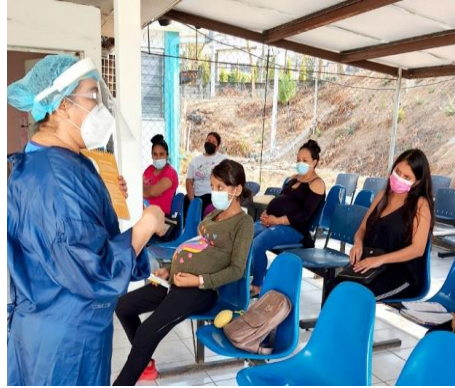
AREA DE CONSULTA EXTERNA, PREVIO REMODELACION