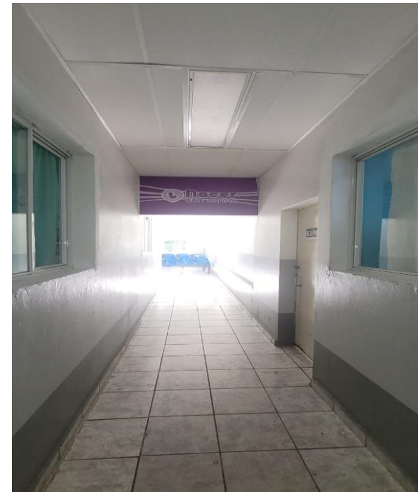
CONSULTA EXTERNA ANTERIOR