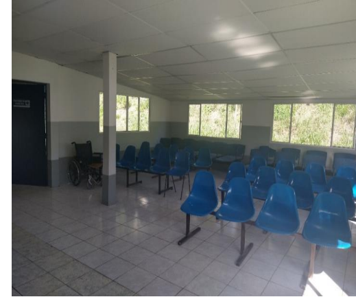
CONSULTA EXTERNA ACTUALMENTE