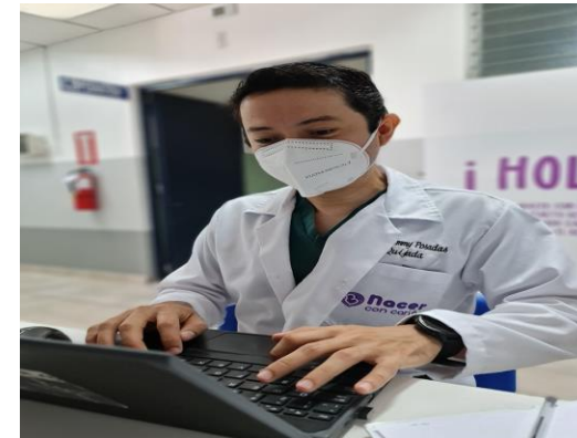
PERSONAL DEL HOSPITAL EN EL USO DEL SIS