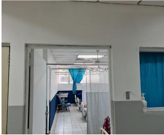
REMODELACION AREA DE HOSPITALIZACION MATERNO