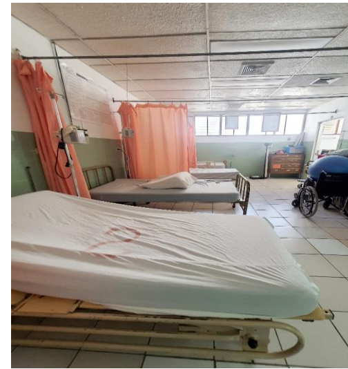
ANTES DE LA REMODELACION DEL CENTRO DE PARTOS