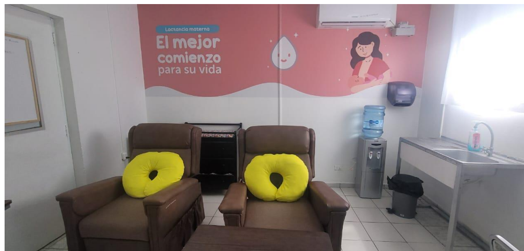
ACTUALMENTE EL BANCO DE LECHE HUMANA