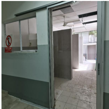
DURANTE LA REMODELACION AREA DE HOSPITALIZACION MATERNO