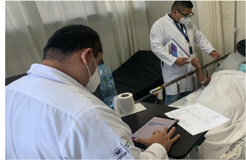
USO DEL SIS EN DIFERENTES ÁREAS DEL HOSPITAL