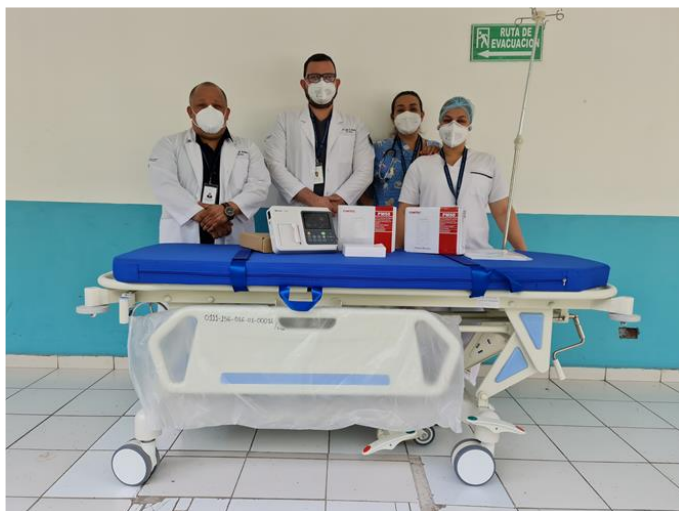
Camilla, monitores de signos vitales portátiles y electrocardiograma.