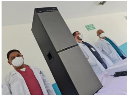
equipo de sonido y control