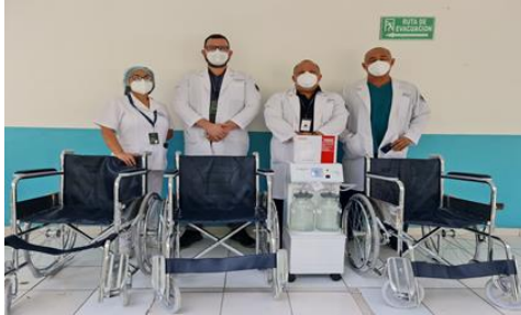
Silla de ruedas y equipo de succion