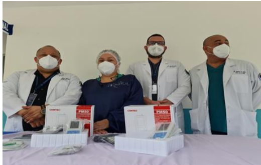
Monitores portatiles de equipo