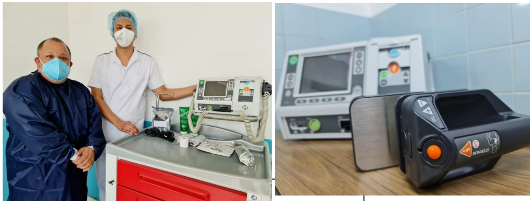
EQUIPO DE DESFRILACION