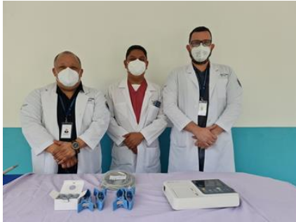
equipo de electrocardiograma