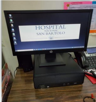
COMPUTADORAS DE ESCRITORIO Y PORTATIL