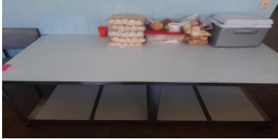
MESA CON RODOS DE ACERO INOXIDABLE