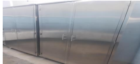
MUEBLE TIPO ALACENA