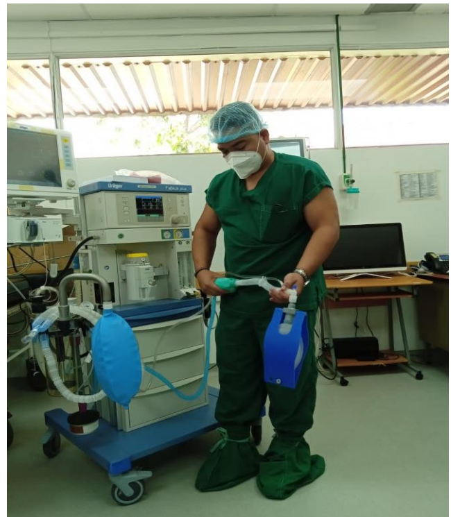
MÁQUINA DE ANESTESIA