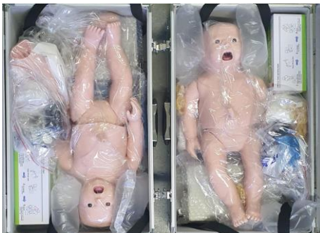
MANIQUÉS PARA DAR CAPACITACIONES SOBRE REANIMACIÓN PEDIÁTRICA Y NEONATAL