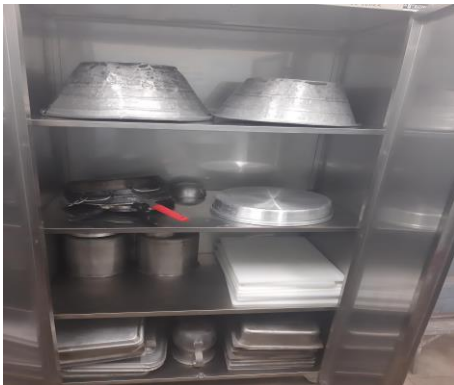
MUEBLE TIPO ALACENA