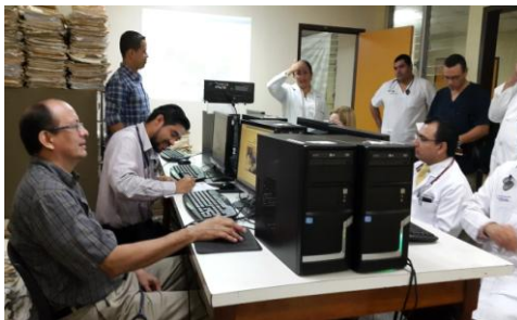
Capacitación a Médicos Especialistas en el Expediente en Línea