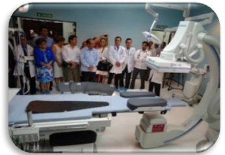
Unidad de Cateterismo Cardíaco