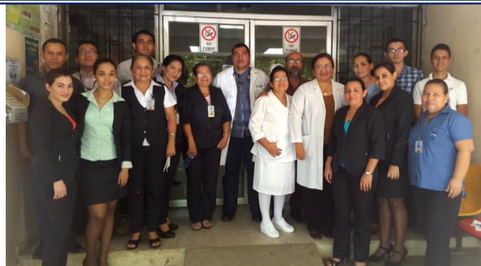
Personal del Sistema Integral de Atención al Paciente, SIAP