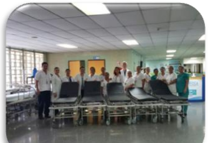
Compra de Equipos