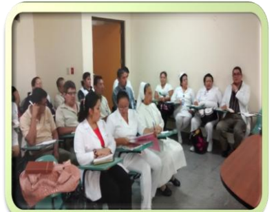
Donación de cunas Pediátricas