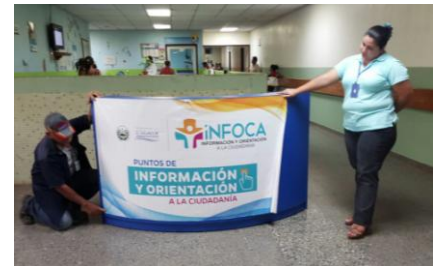
INFOCA en Emergencias