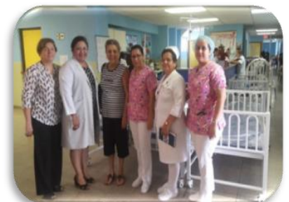
Donación de cunas Pediátricas