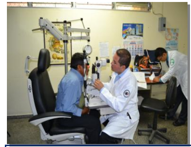
Unidad de Oftalmología.