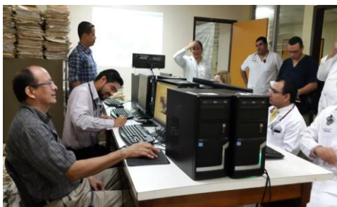
Capacitación a Médicos Especialistas en el Expediente en Línea