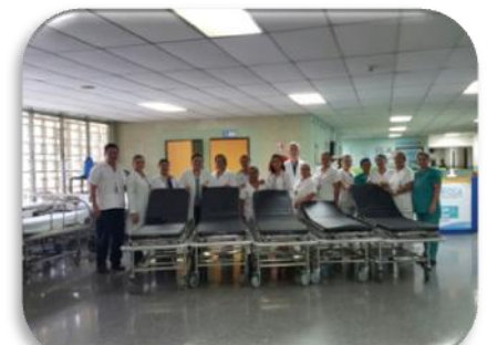
Compra de Equipos