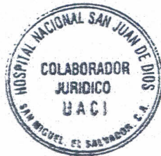
COLABORADOR JURÍDICO UACI