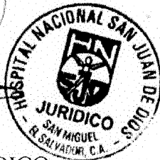
Vo. Bo. COLABORADOR JURÍDICO