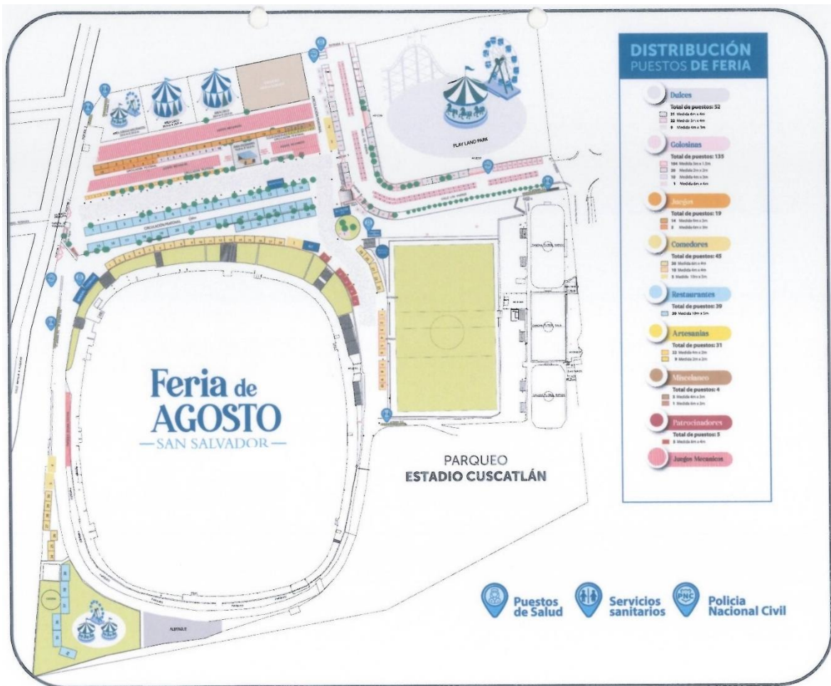
Anexo n.º 12: Croquis campo de la feria