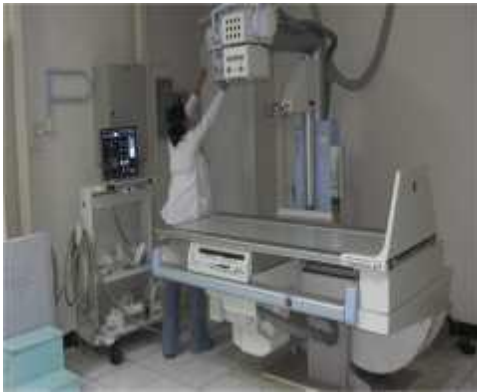
Mesa de Rayos X digital con Fluoroscopia