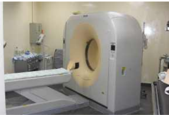
Tomografía axial computarizada