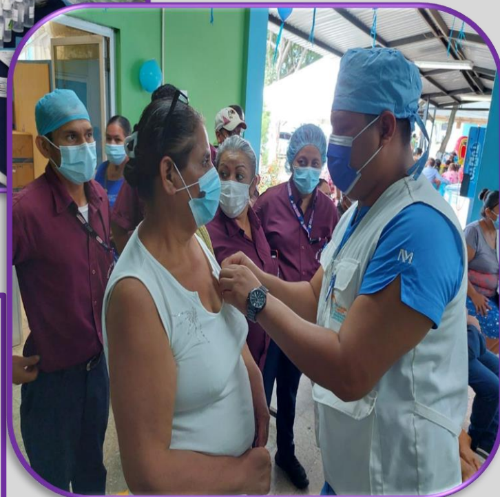
DIA MUNDIAL DE LA DIABETES EN APOYO CON ASADI Y CLUB DE DIABETES, ODS DEL HOSPITAL